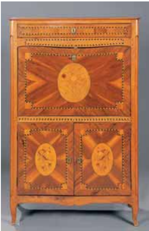
Secrétaire à abattant en noyer marqueté de fleurs et oiseaux. Transition des Epoques Louis XV-Louis XVI. H. 143 x L. 89 x P. 40 cm 2.500/3.000 €