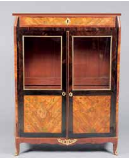
Vitrine à doucine à hauteur d'appui en placage de bois de rose et palissandre. Estampillée JM. CHEVALLIER. Transition des Epoques Louis XV-Louis XVI. H. 140 x L. 113 x P. 39 cm 3.000/4.000€