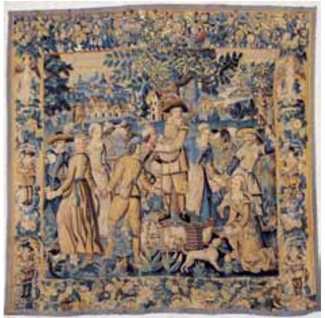
Tapiserie XVIIème siècle. Danse villageoise à la cornemuse. Belle bordure à décor de fruits, fleurs et joueur de mandoline. 281 x 311 cm. (restaurations) 10.000/12.000 €