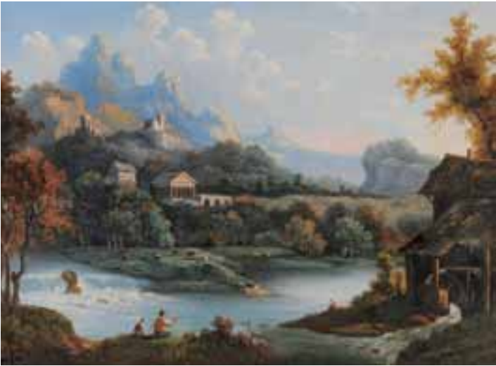
Ecole Suisse du XIXème siècle. Paysage aux pêcheurs dans la montagne. Huile sur toile. 48 x 65 cm.