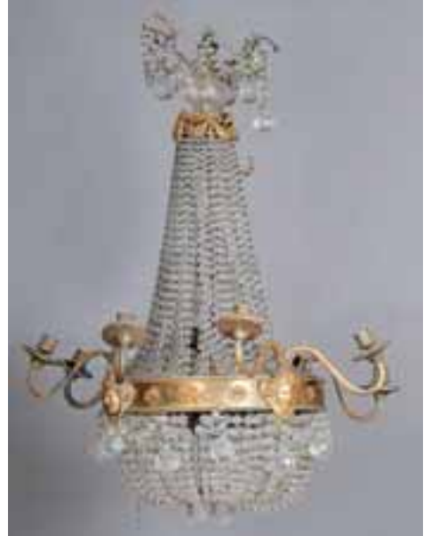
Lustre à perles et pampilles à huit bras de lumière. Monture laiton à décor de torchères. H. 90 cm 1.300/1.500 €