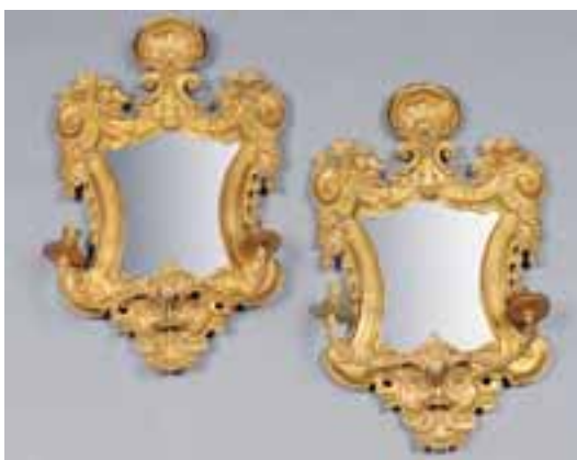
Paire d'appliques à deux lumières à fond de glace en bronze doré. XIXème siècle. H. 60 x L. 40 cm 3.000/4.000 €