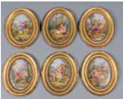
Suite de six peintures sur porcelaine. XIXème siècle. 22,5 x 16 cm 1.000/1.500 €