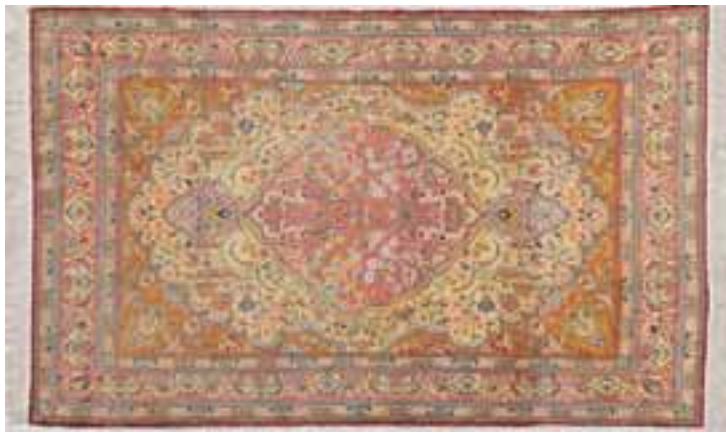
Anatolie Soie. 206 x 125 cm