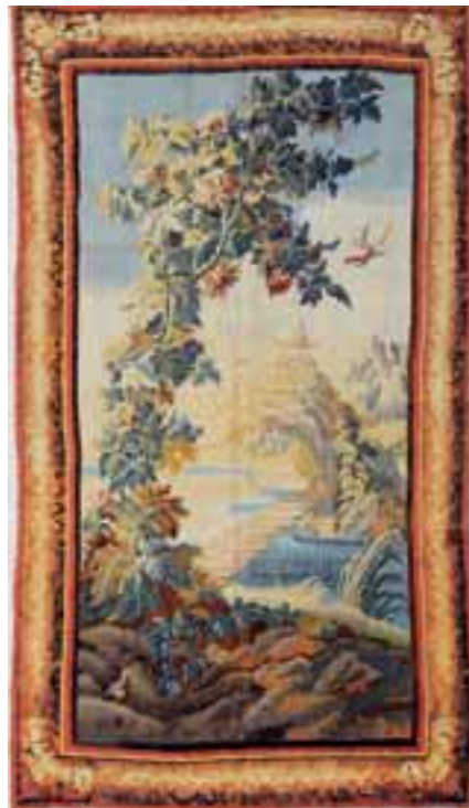
AUBUSSON XVIIIème siècle. Tapisserie à décor de pagodes, volatiles. D'après un carton de Pillement & Huet.