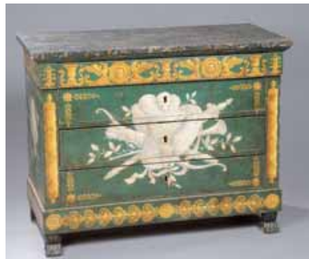
Commode en bois peint à décor d'attributs guerriers. Dessus façon marbre. Epoque Empire. H. 90 x L. 113 x P. 58 cm 5.500/6.500 €