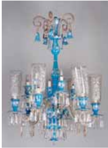
Important lustre à douze bras de lumière en opaline. Modèle Baccarat. Vers 1880. H. 120 x L. 80 cm 3.000/4.000 €