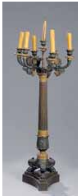
Candélabre en bronze patiné et doré à six bras et sept lumières. Epoque Restauration. H. 110 cm 3.500/4.500 €