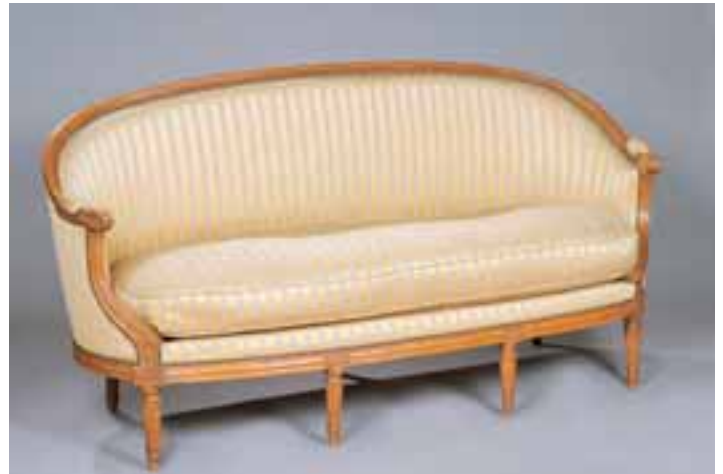
Canapé corbeille en bois naturel. Estampillé LANGLOIS. Epoque Louis XVI. H. 91 x L. 180 x P. 80 cm 2.500/3.000 €