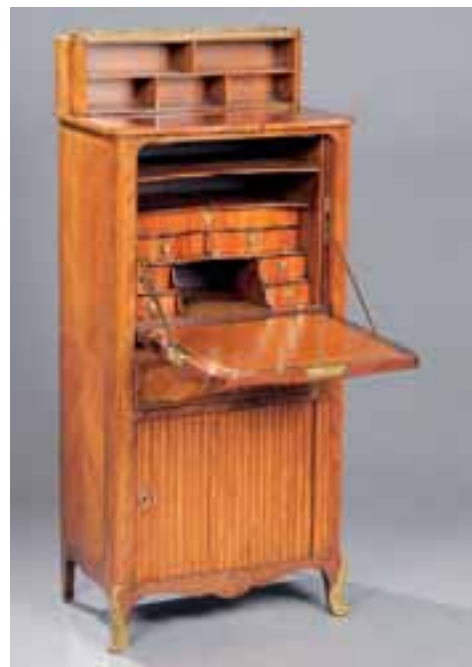
Petit secrétaire à gradin en placage de bois de rose. Estampillé DUBUT reçu Maître en 1760. Epoque Louis XV. (gradin postérieur) H. 128 x L. 56 x P. 35 cm. 5.000/6.000 €