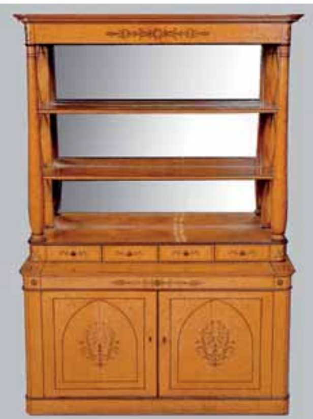
Importante étagère formant buffet en placage d'érable moucheté et amarante. Epoque Charles X. H. 191 x L. 138 x P. 50 cm 8.000/10.000 €