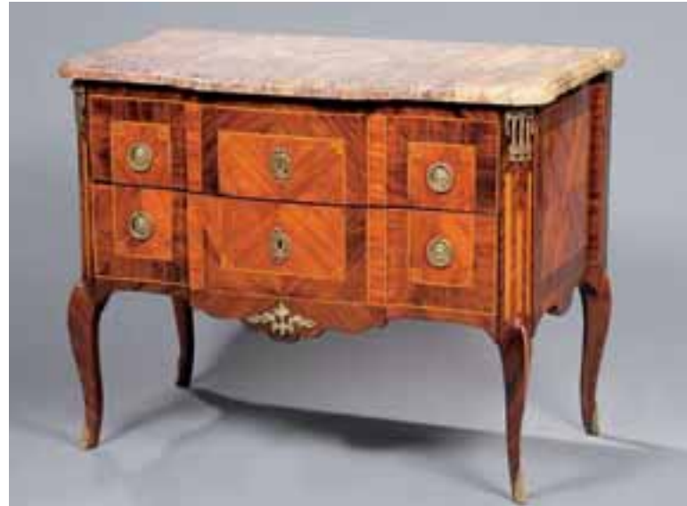
Commode à ressaut ouvrant à deux tiroirs sans traverse en placage de bois de rose et palissandre. Dessus de marbre rose. Transition des Epoques Louis XV-Louis XVI. H. 91 x L. 121 x P. 65 cm 8.000/10.000 €