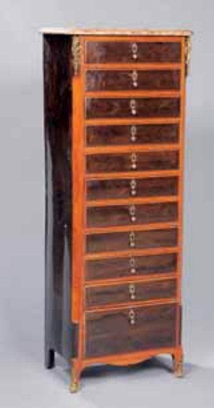
Chiffonnier en placage de palissandre. Il ouvre à onze tiroirs. Dessus marbre. Estampille JLF LEGRY, reçu Maître en 1779. Transition des Epoques Louis XV-Louis XVI. H. 165 x L. 60 x P. 42,5 cm 4.000/5.000 €