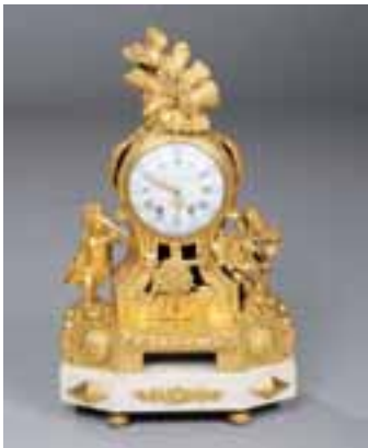
Pendule en bronze doré. Cadran de J.Y. Hentschel à Strasbourg. Epoque Louis XVI. H. 47,5 x L. 28 cm 3.000/4.000 €