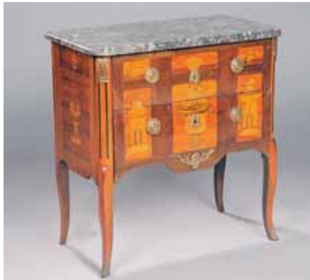
Commode à deux tiroirs sans traverse. Belle marqueterie d'une garniture fleurie. Transition des Epoques Louis XV-Louis XVI. Porte une estampille AAA. H. 84 x L. 80 x P. 44 cm 8.000/10.000 €