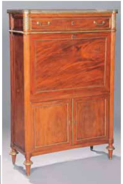
Secrétaire à abattant en acajou et placage d'acajou. Dessus de marbre à galerie repercée. Epoque Louis XVI. H. 142 x L. 93 x P. 38 cm. (restaurations d'usage) 3.000/4.000 €