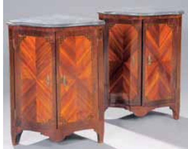
Paire d'encoignures en marqueterie de forme galbée. Modèle Louis XV exécuté au début du XIXème siècle. H. 89 x L. 68 x P. 46 cm 2.200/2.500 €