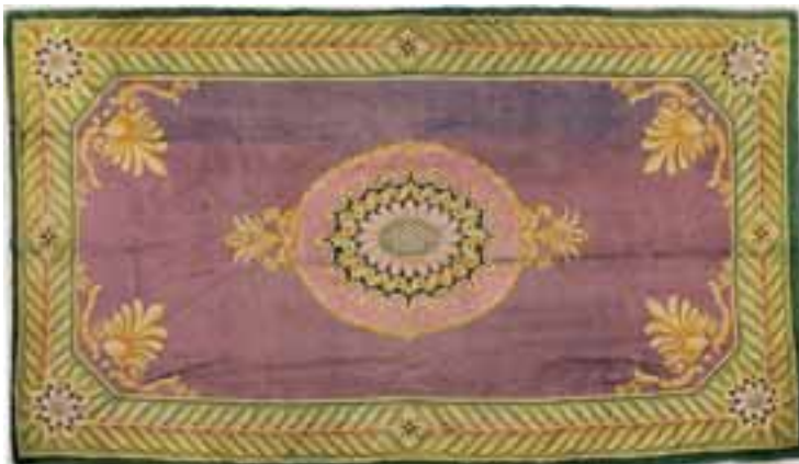
SAVONNERIE fin XVIIIème début XIXème siècle. 550 x 284 cm