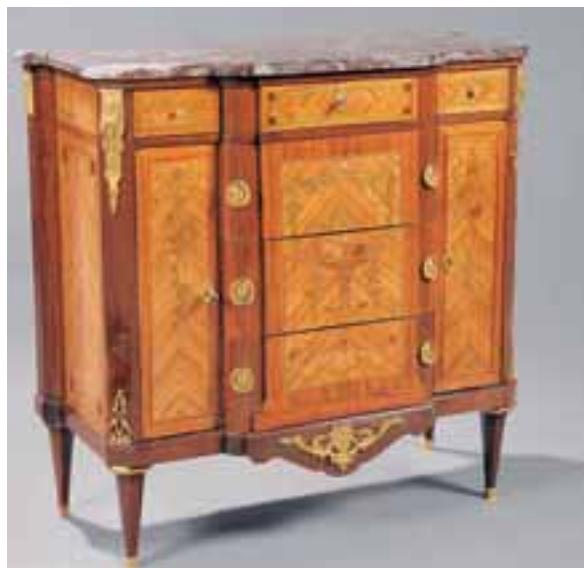
Buffet à hauteur d'appui en placage de bois de rose, marqueté de fleurs. Façade à double ressaut à quatre rangs de tiroirs et deux portes latérales. Transition des Epoques Louis XV-Louis XVI. H. 110 x L. 113 x P. 50 cm 3.000/4.000 €