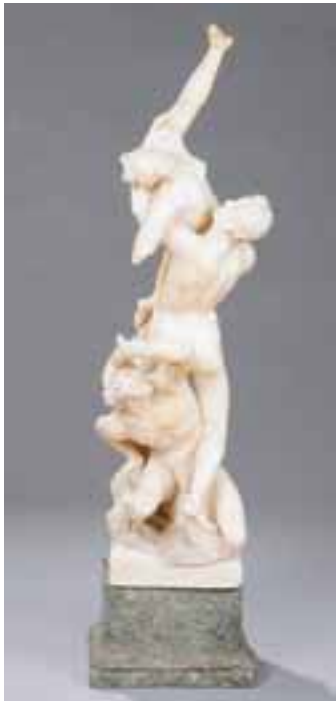
L'enlèvement de Proserpine. Marbre blanc. H. 95 x L. 27 cm (sans socle). (acc. et mques) 2.000/3.000 €