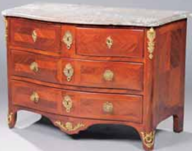
Commode galbée en placage d'amarante à trois rangs de tiroirs. Bronzes au C couronné. Epoque Régence. Porte une estampille FG. H. 87 x L. 130 x P. 65 cm