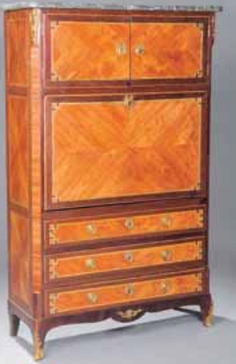
Secrétaire à guillotine en placage de bois de rose et encadrement de citronnier teinté. Transition des Epoques Louis XV-Louis XVI H. 163 x L. 100 x P. 38 cm. 5.000/6.000 €