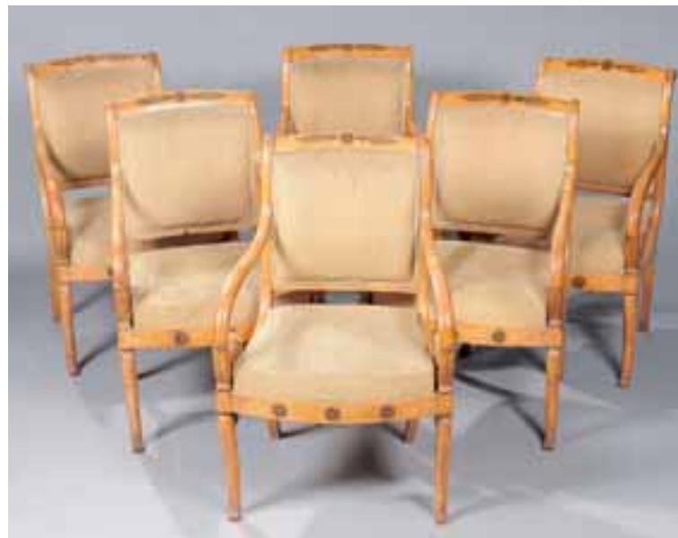
Suite de six fauteuils en placage d'érable moucheté et amarante. H. 89 x L. 60 x P. 63 cm 8.000/9.000 €