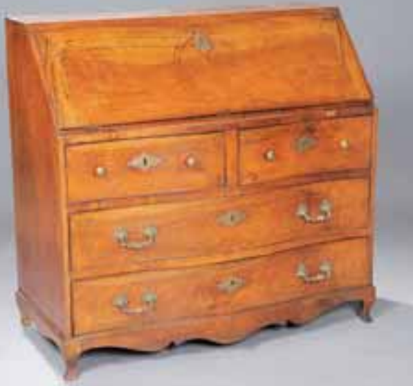
Commode secrétaire en acajou ouvrant par un abattant et trois rangs de tiroirs. Angleterre XVIIIème siècle. H. 110 x L. 118 x P. 54 cm 2.000/2.500 €