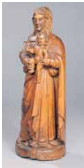
Vierge à l'enfant. Statue en bois naturel du XIXème siècle. H. 75 cm 1.200/1.500 €