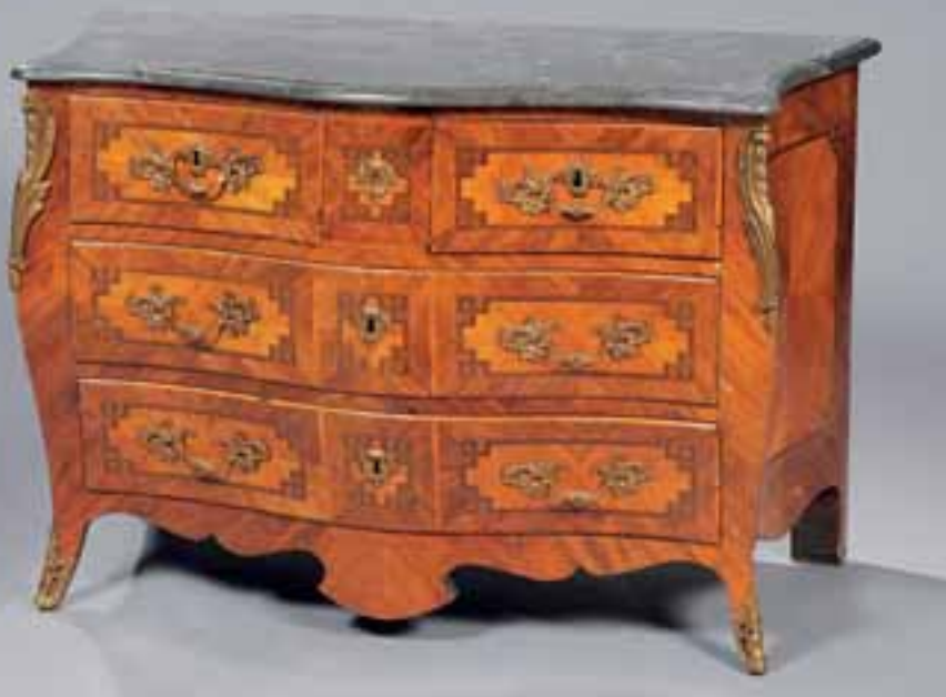
Commode galbée à trois rangs de tiroirs, marquetée de bois de rose. Epoque Louis XV. Dessus marbre gris H. 86 x L. 131 x P. 65 cm 8.000/10.000 €