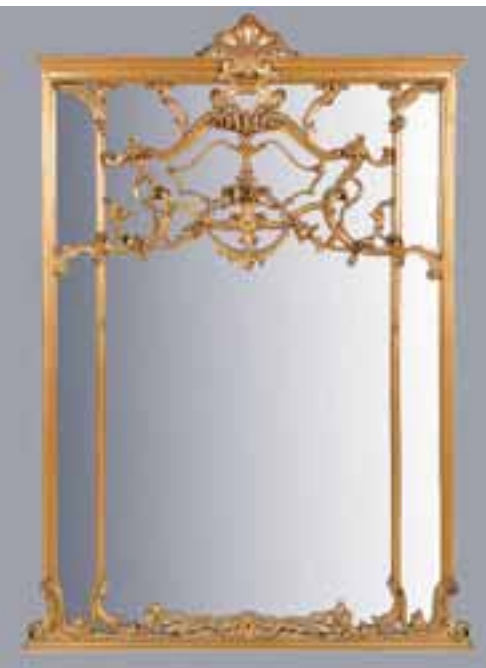
Grand miroir en bois doré. Travail italien de style Louis XVI. H. 216 x L. 146 cm 2.000/2.500 €