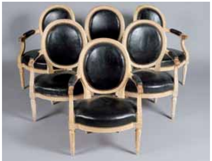
Suite de six fauteuils en bois laqué modèle à entrelacs. Estampillés DUPAIN. Epoque Louis XVI. H. 64 x L. 57 x P. 57 cm 8.000/10.000 €