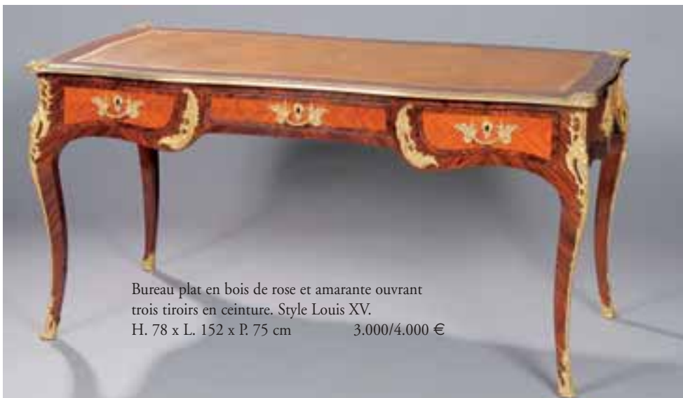
Bureau plat en bois de rose et amarante ouvrant trois tiroirs en ceinture. Style Louis XV. H. 78 x L. 152 x P. 75 cm 3.000/4.000 €