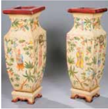
Paire de grands vases en bois peint. Décor au chinois. Fin XIXème siècle. H. 92 cm 8.000/9.000 €