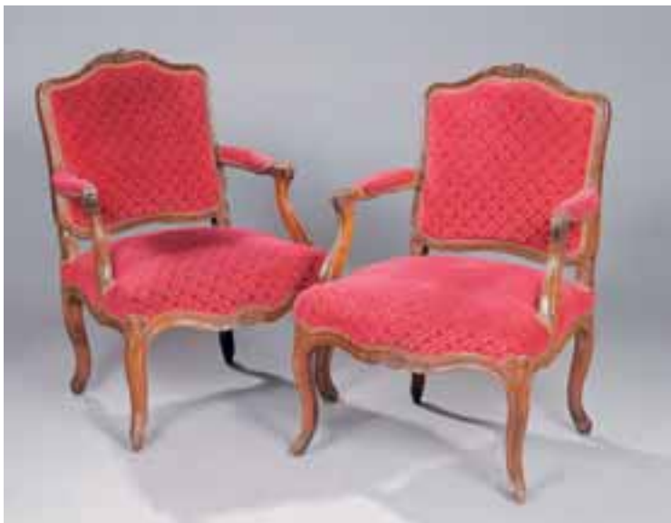
Paire de fauteuils à dossiers plats. Epoque Louis XV. H. 92 x L. 63 x P. 68 cm.