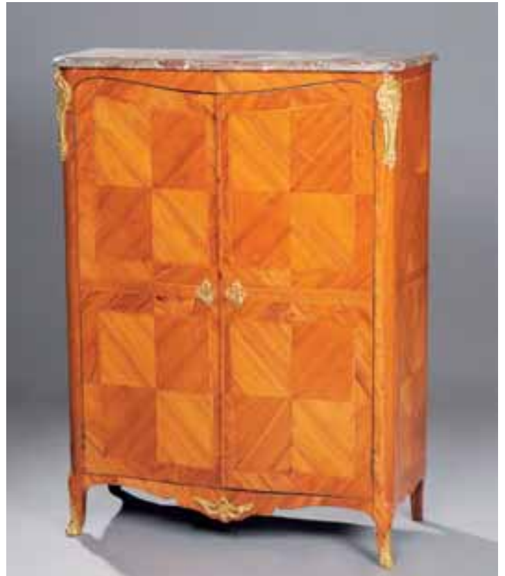
Petite armoire en placage de bois de rose à façade et côtés galbés. Estampillée BONNEMAIN, reçu Maître en 1753. Epoque Louis XV. H. 132 x L. 100 x P. 38 cm 5.000/7.000 €