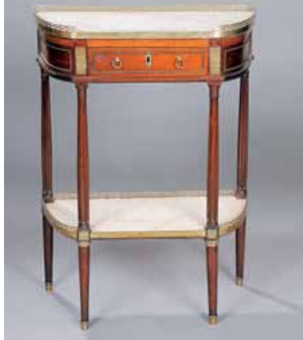
Console desserte en acajou. Un tiroir. Dessus marbre à galerie. Epoque Louis XVI. H. 88,5 x L. 65,5 x P. 33,5 cm 4.000/5.000 €