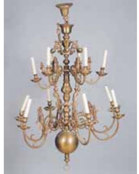
Lustre en bronze à douze lumières. Style Hollandais. H. 120 x L. 105 cm