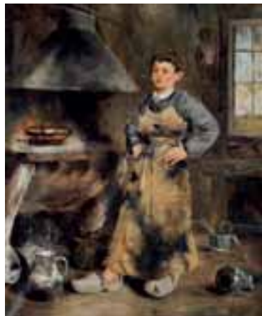
Albert BRUMENT (né en 1905). Le jeune étameur. HST SBD 65 x 55 cm 1.300/1.500 €