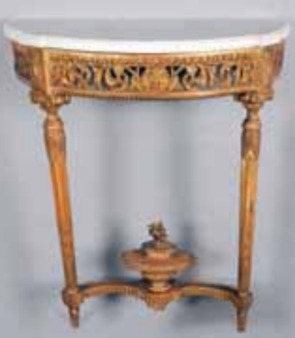
Console en bois doré. Pieds à cannelures rudentées à asperges réunis par une entrejambe à pot de feu. Epoque Louis XVI. H. 89,5 x L. 77,5 x P. 41 cm 2.000/3.000 €