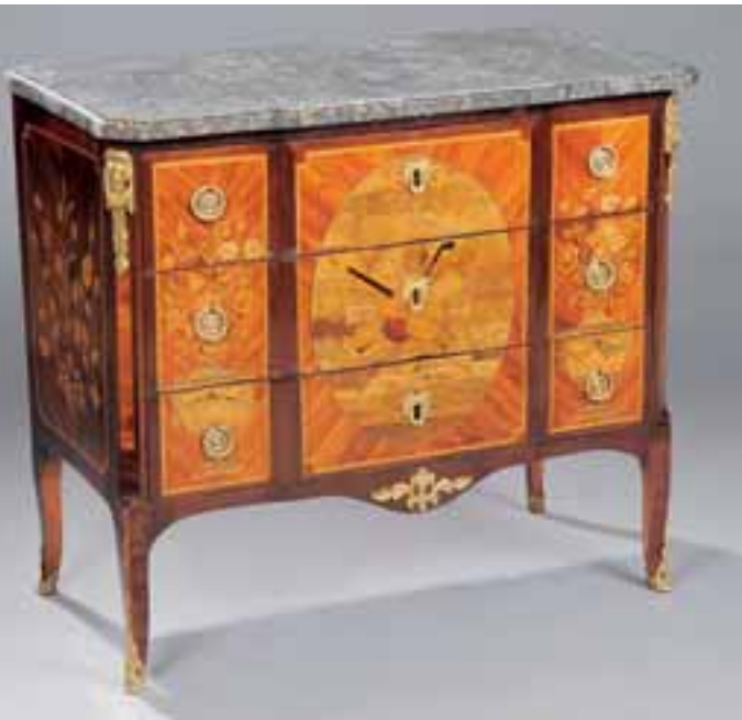
Jolie commode à ressaut à trois tiroirs. Belle marqueterie aux attributs de musique et bouquets de fleurs. Dessus de marbre gris. Estampillé J.F. LETELLIER reçu Maître en 1767. Transition des Epoques Louis XV-Louis XVI. H. 84 x L. 97,5 x P. 49 cm. 10.000/12.000 €