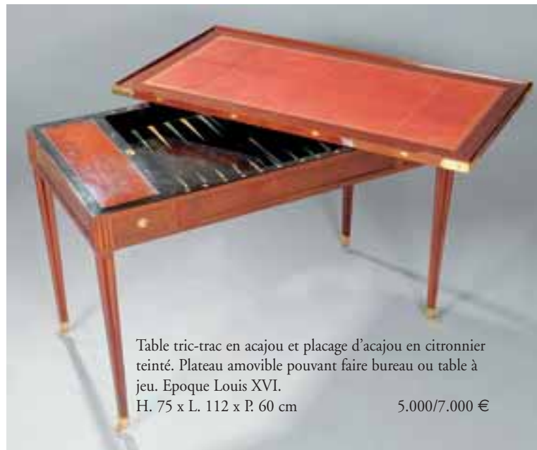
Table tric-trac en acajou et placage d'acajou en citronnier teinté. Plateau amovible pouvant faire bureau ou table à jeu. Epoque Louis XVI. H. 75 x L. 112 x P. 60 cm 5.000/7.000 €