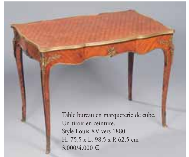
Table bureau en marqueterie de cube. Un tiroir en ceinture. Style Louis XV vers 1880 H. 75,5 x L. 98,5 x P. 62,5 cm 3.000/4.000 €