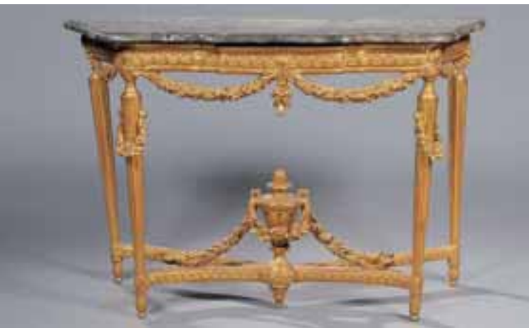
Console en bois doré sculpté de guirlandes de fleurs. Piétement cannelé réuni par une entretoise au pot de feu. Dessus de marbre gris veiné. Epoque Louis XVI. H. 92 x L. 138 x P. 52 cm 4.000/5.000 €