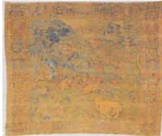
La chasse à l'ours. Peinture sur tissu, fil de soie. Scène piémontaise ou romaine. Renaissance Italienne fin XVIIème, début XVIIIème siècle. 320 x 315 cm. (restaurations) 3.000/4.000 €