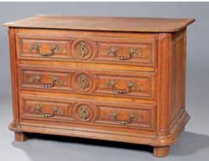
Commode de boiserie en chêne à trois tiroirs. Epoque Louis XIV. H. 89 x L. 131 x P. 68 cm 5.000/7.000 €