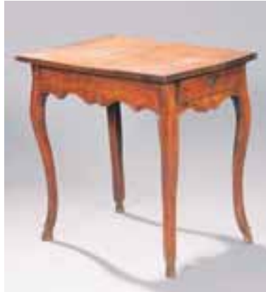
Table en noyer un tiroir latéral. Pieds sabot. Epoque Louis XV. H. 72 x L. 71 x P. 52 cm (qq restaurations) 1.800/2.000 €