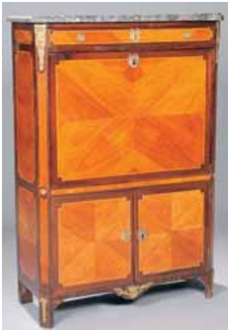
Secrétaire à abattant en placage de bois de rose. (clés à trèfle) Estampillé AVRIL, reçu Maître en 1774. Epoque Louis XVI. H. 146 X L. 95 x P. 40 cm 3.500/4.500 €