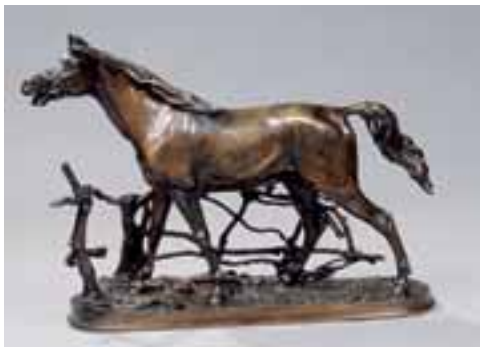
P.J. MENE (1810-1879) Le cheval à la barrière. Bronze à patine brune signé 29 x 39 cm 4.000/5.000 €