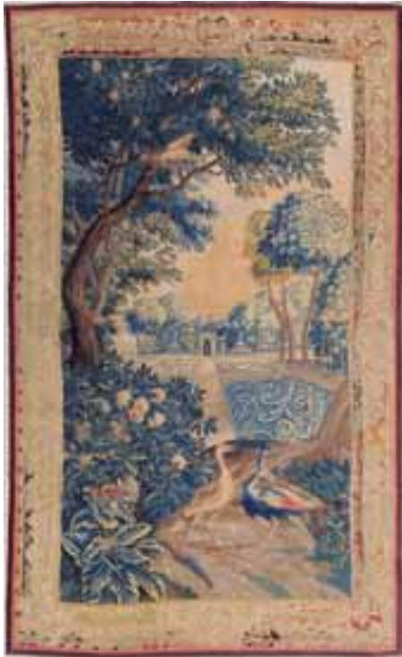
AUBUSSON XVIIIème siècle. Tapisserie à décor, jardin, fleurs, feuillages, volatiles et fontaine.