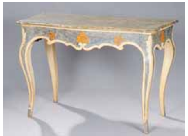
Console en bois polychrome. Italie début XIXème siècle. H. 84 x L. 127 x P. 63 cm 2.500/3.000 €