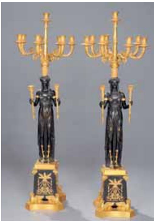
Importante paire de candélabres en bronze ciselé et doré et bronze patiné à sujet de Renommées ailées soutenant sept bras de lumières. Vers les années 50. H. 116 cm 10.000/12.000 €