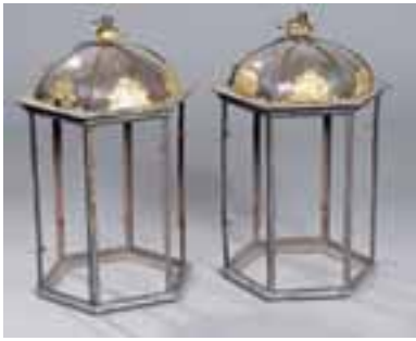
Paire de lanternes en fer forgé et tôle. Fin du XVIIIème siècle. H. 58 - Diam. 39 cm. (restaurations) 2.000/2.500 €