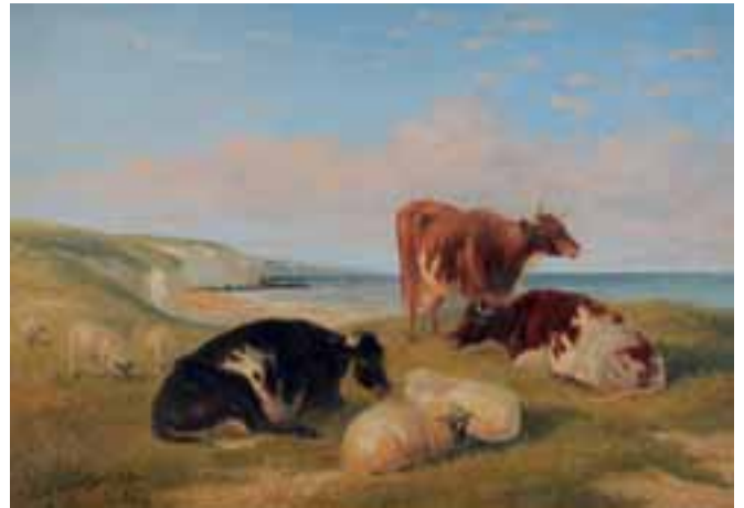
Thomas SIDNEY-COOPER (1803-1902). Vaches et moutons en bord de mer. Peinture sur panneau. SBG et datée 1877. 28,5 x 37 cm