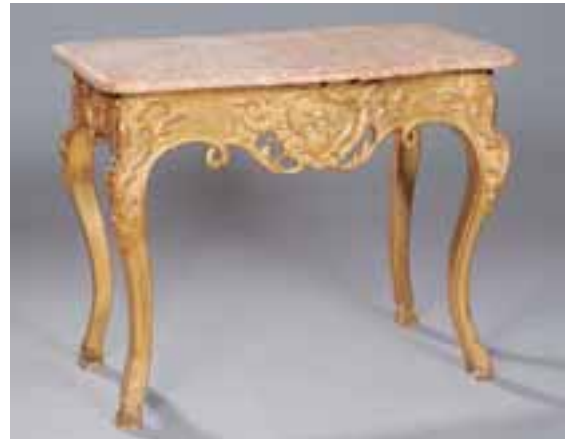
Console provençale en bois doré sculptée de forme galbée reposant sur quatre pieds sabot. Dessus de marbre. Epoque Régence. H. 80,5 x L. 101,5 x P. 57,5 cm 5.000/6.000 €