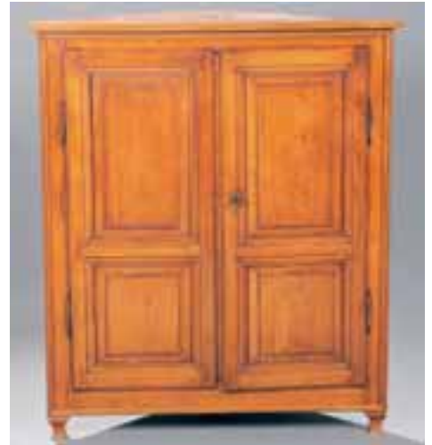
Encoignure en merisier massif. Vers 1800. H. 117 x L. 100 x P. 50 cm 1.200/1.500 €