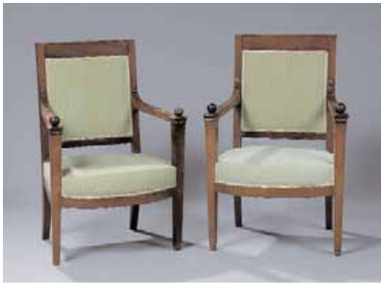
Paire de fauteuils en acajou. Epoque Consulat H. 89 x L. 61 x P. 56 cm 1.300/1.400