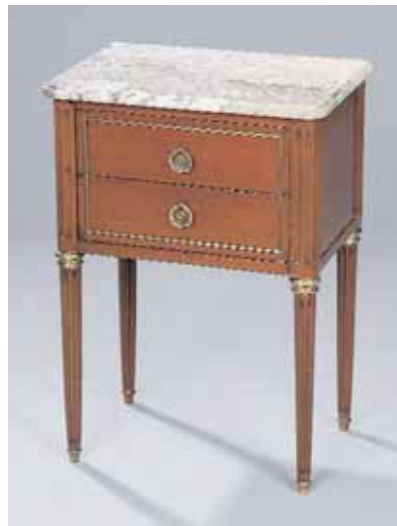
Table de chevet en acajou Epoque Louis XVI H. 70 x L. 50 x P. 34,5 cm 1.000/1.200