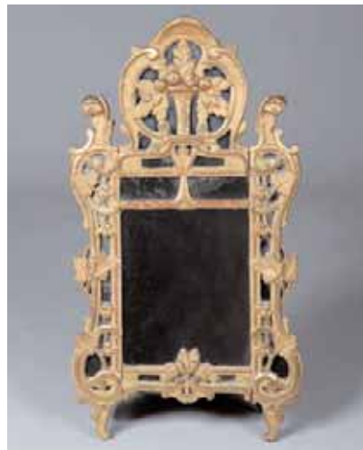
Petite glace en bois doré à réserve à décor de feuilles et de fruits 91 x 50 cm 800/1.000