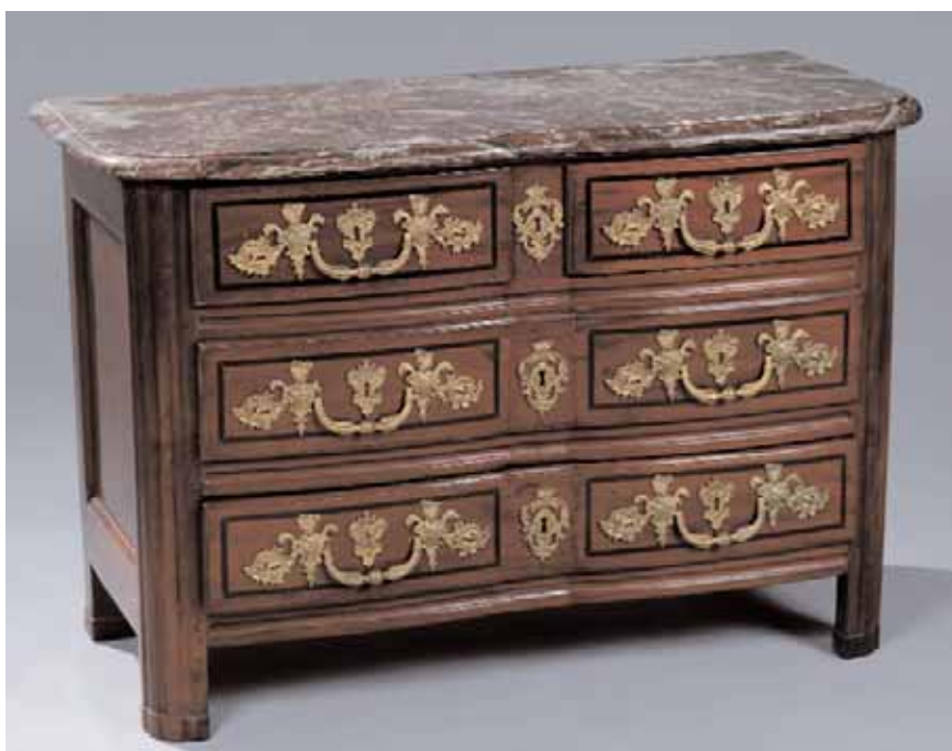
Commode en acajou à façade arbalète ouvrant à trois rangs de tiroirs Montants à cannelures Beaux bronzes représentant des personnages en buste Dessus de marbre rosé veiné Epoque Louis XIV H. 80 x L. 117 x P. 55 cm