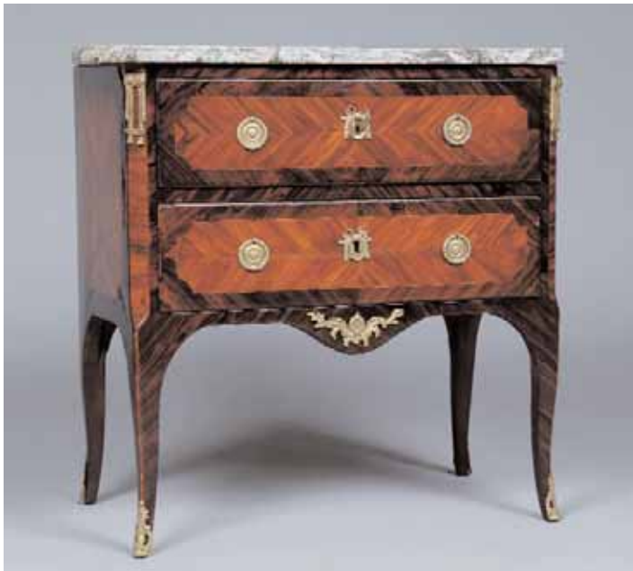
Commode en placage de bois de rose et amarante ouvrant à deux tiroirs Estampillée I.O. SCHLICHTIG. Transition des Epoques Louis XV et Louis XVI H. 83 x L. 79 x P. 43 cm 5.000/6.000