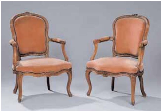
Deux fauteuils formant une paire en noyer, moulurés et sculptés de fleurs Epoque Louis XV H. 88 x L. 60,5 x P. 63 cm 1.300/1.500