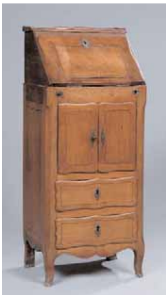
Petit meuble écritoire en bois fruitier. XVIIIème siècle H. 100,5 x L. 42 x P. 33,5 cm 800/1.000