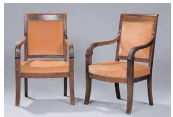
Paire de fauteuils en acajou et placage d'acajou Epoque Empire H. 90 x L. 57,5 x P. 57,5 cm 1.000/1.500