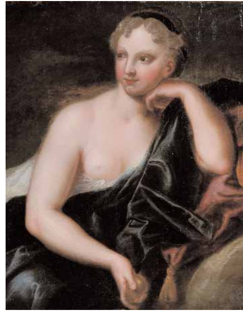
Ecole française du XVIIIème siècle Portrait de jeune femme Huile sur toile 51 x 43,5 cm 1.000/1.500