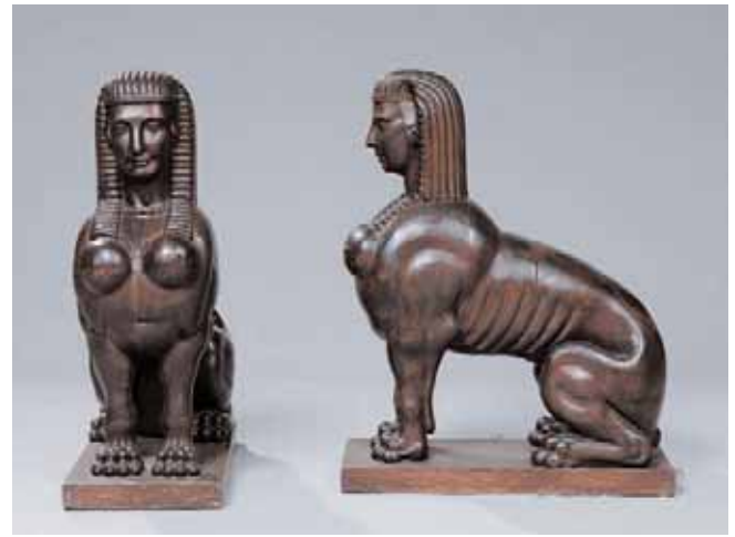
Paire de sphinges assis en bois exotique Epoque Empire H. 72,5 x L. 56 x P. 26 cm (socle postérieur) 6.500/7.500