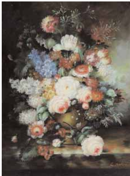
L. MARTIN. Vase fleuri, pivoines, tulipe Coupe fleurie et fruits sur un entablement Deux huiles sur toile, signées en bas à droite 102 x 75,5 cm 2.000/3.000