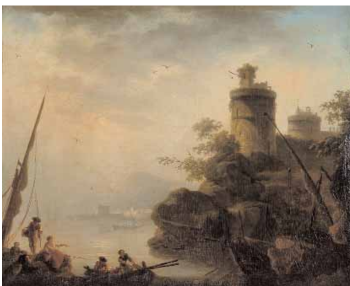
Ecole Française, suiveur de Charles François GRENIER DE LA CROIX, dit LACROIX DE MARSEILLE, vers 1810

Pêcheur eu bord d'un paysage méditerranéen