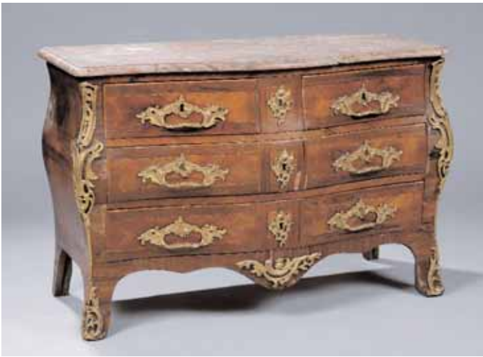
Commode tombeau à façade et côtés galbés en bois de placage. Belle garniture de bronze Estampillée I.O. SCHLICHTIG Dessus de marbre Epoque Louis XV H. 89 x L. 130 x P. 65,5 cm (accident au placage)