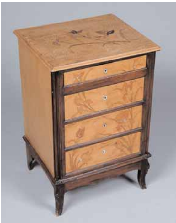
Petite commode ouvrant à quatre tiroirs. Marqueterie de fleurs en bois et nacre Signé GALLÉ. H. 92,5 x L. 65 x P. 52 cm (accident au placage) 2.000/2.500