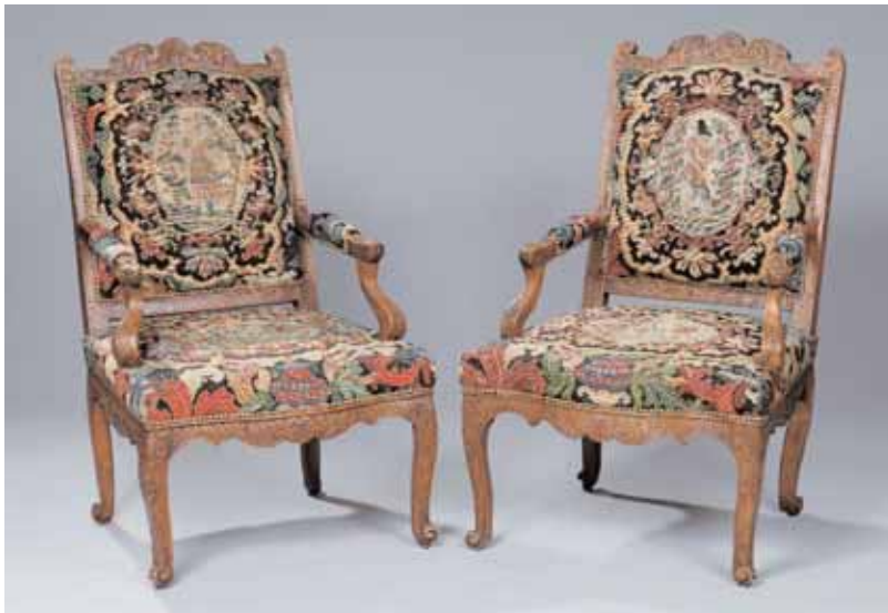
Paire de fauteuils à dossiers plats en bois richement sculpté de coquilles et feuillages Epoque Régence Belle garniture de tapisserie au petit point H. 101 x L. 64,5 x P. 75 cm 6.000/8.000