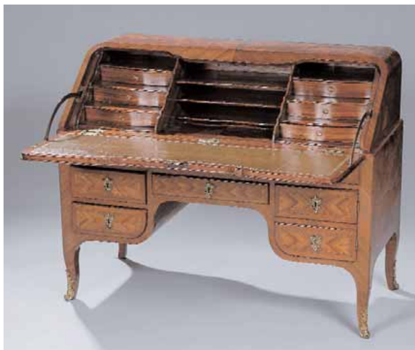
Bureau de pente toutes faces en placage de bois de rose. Il ouvre par un abattant découvrant six petits tiroirs, casiers et secret, trois tiroirs simulés, trois tiroirs et un petit vantaux Transition des Epoque Louis XV et Louis XVI H. 104 x L. 130 x P. 56 cm 10.000/15.000