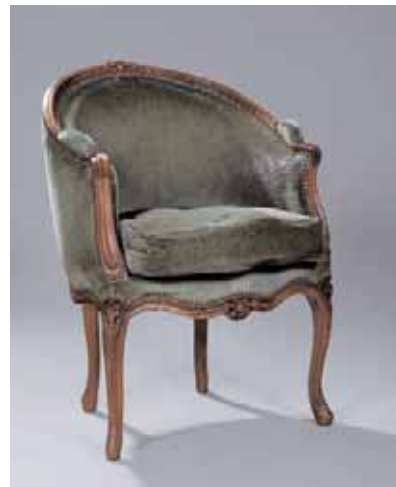
Fauteuil de bureau de forme gondole Epoque Louis XV H. 83 x L. 55 x P. 58 cm