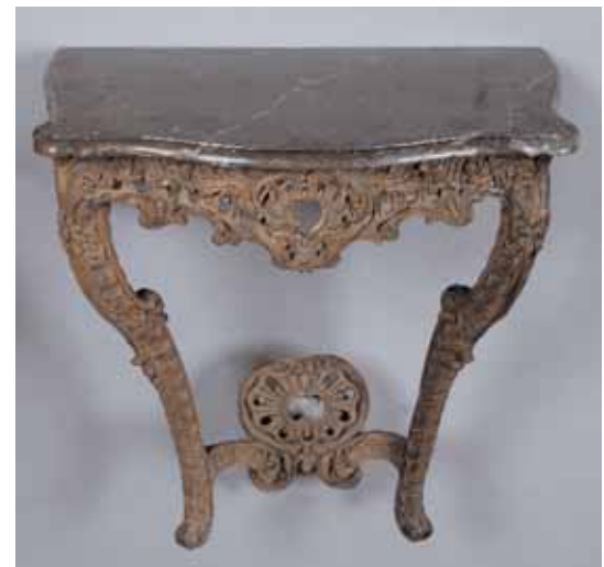
Console en chêne richement sculptée de coquilles. Dessus de marbre Epoque Régence H. 75,5 x L. 81,5 x P. 48 cm