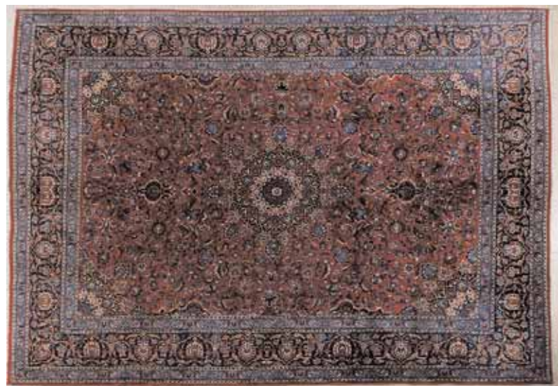
KASHAN. Médaillon central sur fond lie de vin à décor de fleurs et feuilles Vers les années 40-50 364 x 279 cm 1.000/1.500