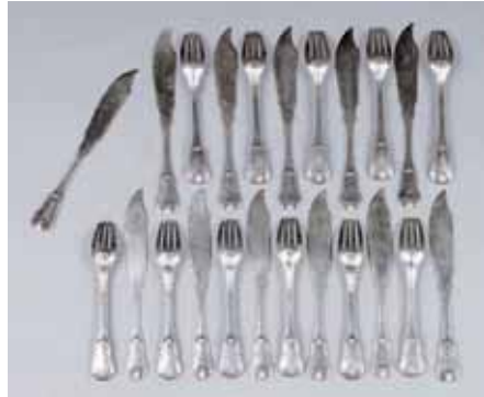
Onze couverts à poissons et un couteau en argent MO CARDEILHAC. Poids : 1.532 g. 800/1.000