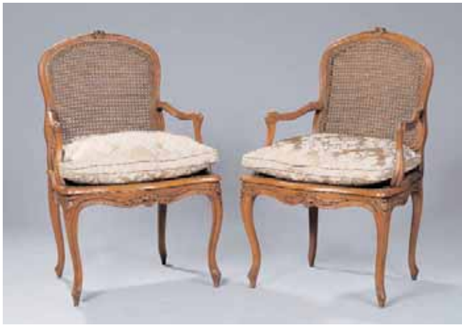
Paire de fauteuils cannés en noyer à dossiers plat. Epoque Louis XV H. 96 x L. 62 x P. 58 cm 4.000/5.000

Service à entremets en vermeil comprenant dix-huit cuillères, dix-huit fourchettes, dix-huit couteaux lame métal et dix-huit couteaux lame vermeil (avec coffret) Poids total sans les couteaux lame métal : 2.755 g 2.000/3.000