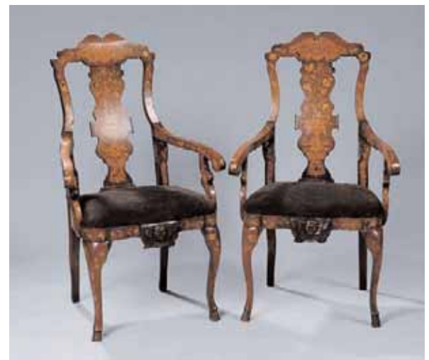
Paire de fauteuils en bois de placage, marquetés de fleurs et paniers fleuris XIXème siècle H. 116,5 x L. 69,5 x P. 60,5 cm 2.000/3.000