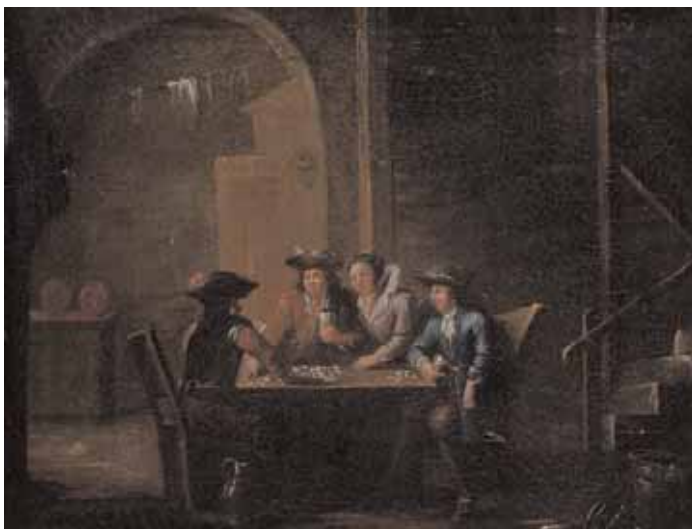
Ecole du XVIIIème siècle La partie de cartes Huile sur toile 32 x 40,5 cm 2.500/3.000