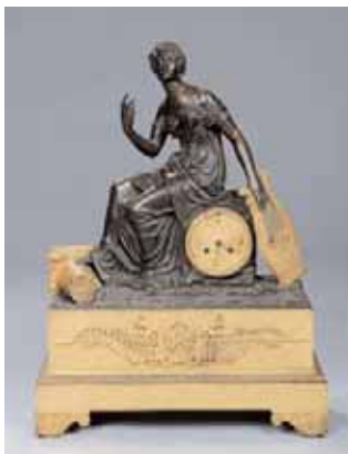
Pendule en bronze à patine brune et dorée, surmontée d'une musicienne Vers 1820 H. 62 x L. 47 x P. 17,5 cm 1.500/1.800