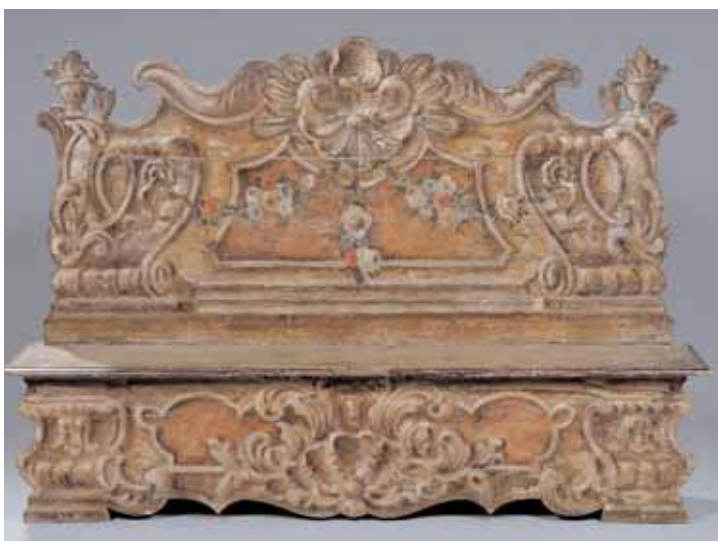
Paire de bancs coffres en bois peint Décor de coquilles et guirlandes de fleurs Venise XIXème siècle H. 128 x L. 188,5 x P. 40,5 cm (restauration d'usage) 8.000/9.000