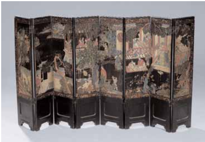
Petit paravent en laque de Coromandel à huit feuilles XIX ème siècle H. 92 x L. 180 cm (quelques fentes) 1.000/1.200