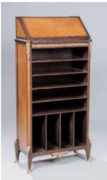
SORMANI P. Classeur en bois de placage Style Transition Signé sur la serrure H. 154 x L. 68 x P. 38 cm 3.000/4.000