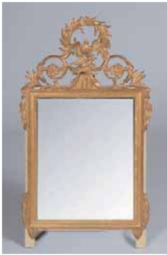
Glace en bois doré à décor de volatiles et palmes Epoque Directoire (un éclat) 99 x 55 cm 700/800