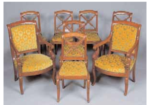
Six chaises et deux fauteuils en acajou Style Empire Fauteuil : H. 91 x L. 55 x P. 61 cm Chaises : H. 84 x L. 44 x P. 45,5 cm 1.500/2.000