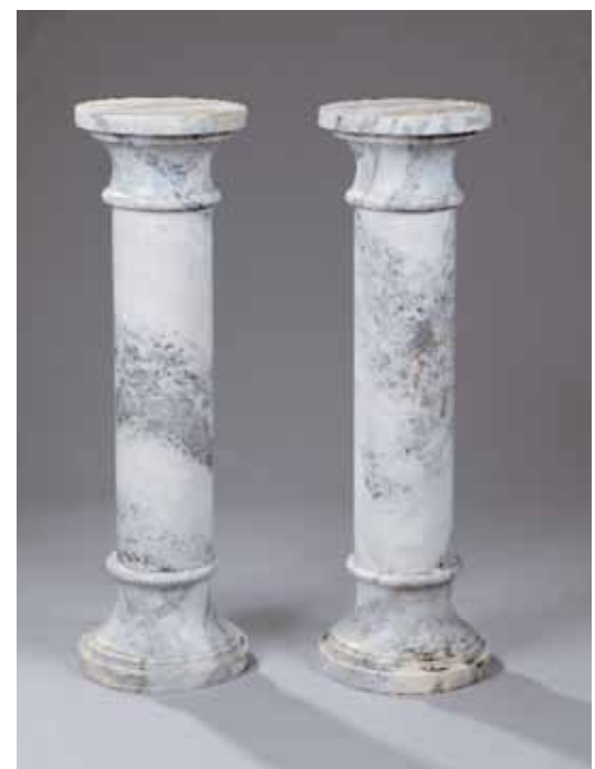
Paire de colonnes en marbre en trois éléments Fin XIX ème siècle H. 110 cm Diamètre : 32 cm 1.500/2.000