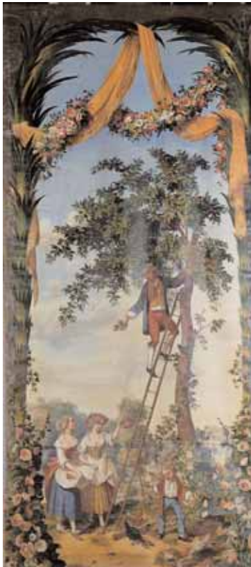
Ecole française du XIXème siècle La cueillette des cerises Peinture sur toile 387 x 190 cm 2.000/2.500