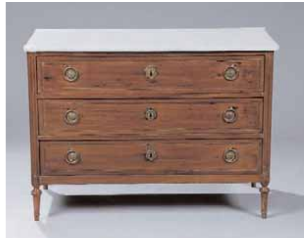
Commode en placage d'acajou à trois tiroirs Dessus de marbre Epoque Louis XVI H. 83 x L. 114,5 x P. 54 cm (accident au marbre) 2.500/3.000