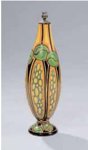
SAINT JEAN DU DESERT Vase en faïence Monogrammé SJD et signé L. BAZET 1923/1930 H. 59 cm 3.000/3.500