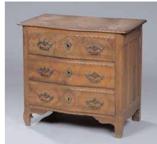
Petite commode en noyer à trois tiroirs. XVIIIème siècle. H. 75 x L. 80,5 x P. 45 cm 1.300/1.500