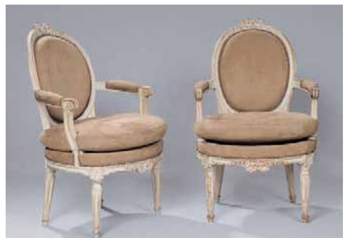
Paire de fauteuils en bois relaqué. Dossier médaillon, sculpté d'un nœud en ceinture et en médaillon Epoque Louis XVI H. 95 x L. 59 x P. 66 cm (restauration d'usage) 3.000/4.000