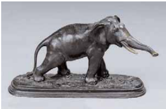
KRAKOWSKY Eléphant Bronze signé H. 20,5 x L. 36,5 cm 1.300/1.800