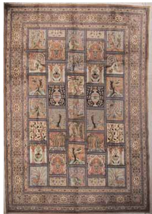
KASHMAR. Les quatre saisons ou les jardins d'Iran 297 x 380 cm 3.000/4.000