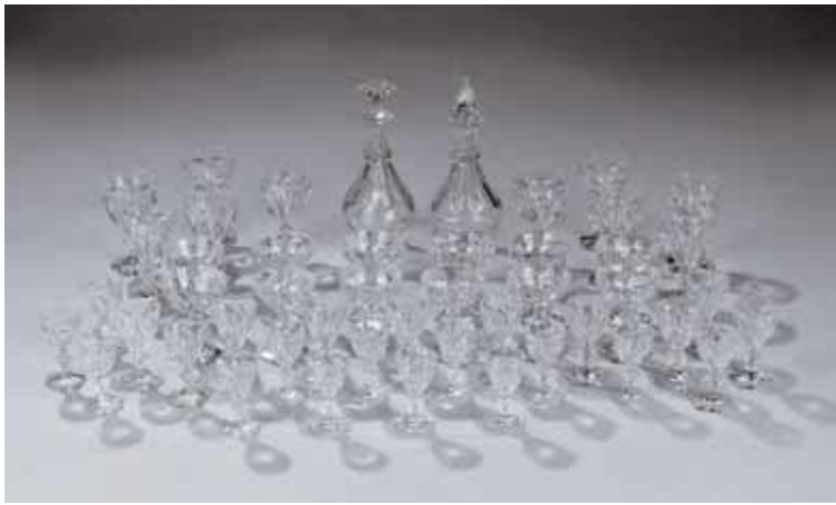
Service de verres en cristal BACCARAT de quarante-huit pièces comprenant douze coupes à champagne, dix verres à eau, dix verres à vin, quatorze verres à porto et deux carafes. Modèle Harcourt.