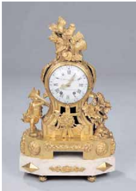
Pendule en bronze doré richement sculpté et ornementé sur le thème de la chasse Cadran de Jean Yves HENTSCHEL à Strasbourg Epoque Louis XVI H. 47,5 x L. 28 x P. 12,5 cm 5.000/7.000