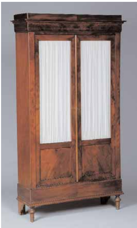
Vitrine en acajou et placage d'acajou Epoque Louis Philippe H. 188 x L. 104,5 x P. 34 cm 1.000/1.200