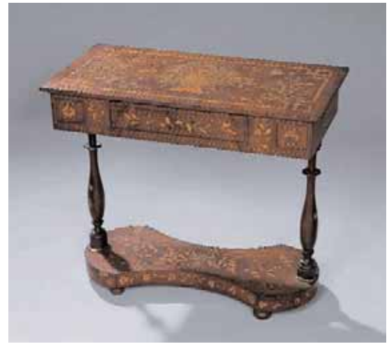
Petite table en bois de placage, marquetée de fleurs. Le tiroir central forme écritoire Hollande, XIX ème siècle H. 76,5 x L. 89 x P. 44 cm (petits manques au placage) 1.200/1.400