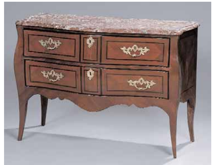
Commode galbée ouvrant à deux tiroirs en placage de noyer Epoque Louis XV Marbre XVIIIème d'un modèle différent H. 82 x L. 116 x P. 53 cm