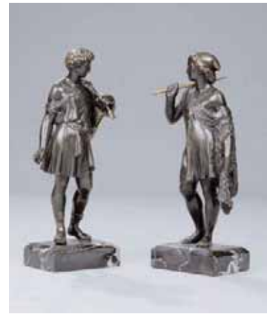
Paire de statuettes en bronze à patine brune représentant un pêcheur et un chasseur XVIIIème siècle H. sans le socle : 23 cm 2.500/3.500