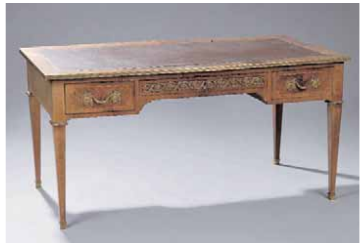
Bureau plat en bois de placage ouvrant à trois tiroirs Garniture de cuir au petit fer Vers 1880-1900 H. 75,5 x L. 151,5 x P. 80 cm 1.500/2.000