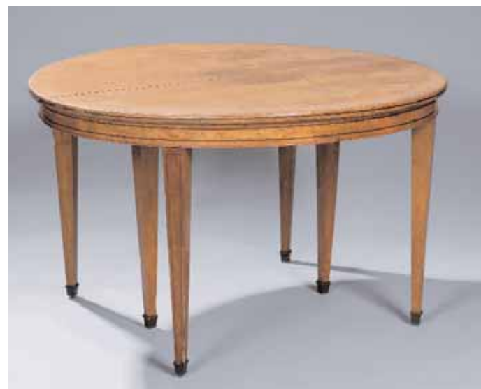
Table ronde en placage d'érable moucheté et filet d'amarante à six pieds Epoque Charles X H. 72 cm - Diam. 120 cm (trois rallonges)