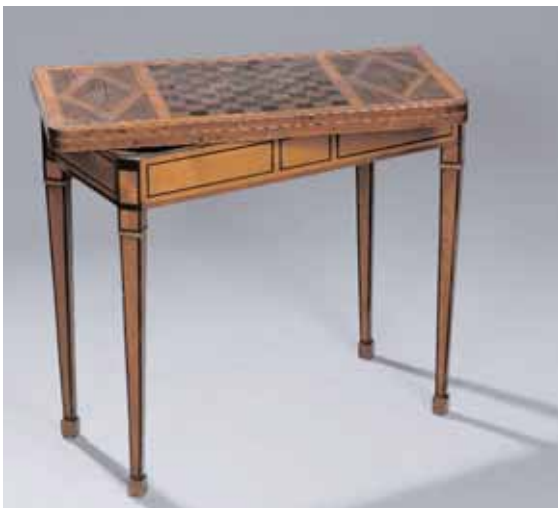
Table à jeu le plateau marqueté de losanges, échiquier ou damier. Epoque Louis XVI H. 74,5 x L. 79 x P. 39,5 cm (léger manque et léger accident de placage) 2.000/3.000