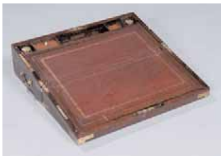
Ecrivoire de voyage (marine) XIXème siècle Longueur ouvert : 49,5 cm Largeur : 50,5 cm 600/700