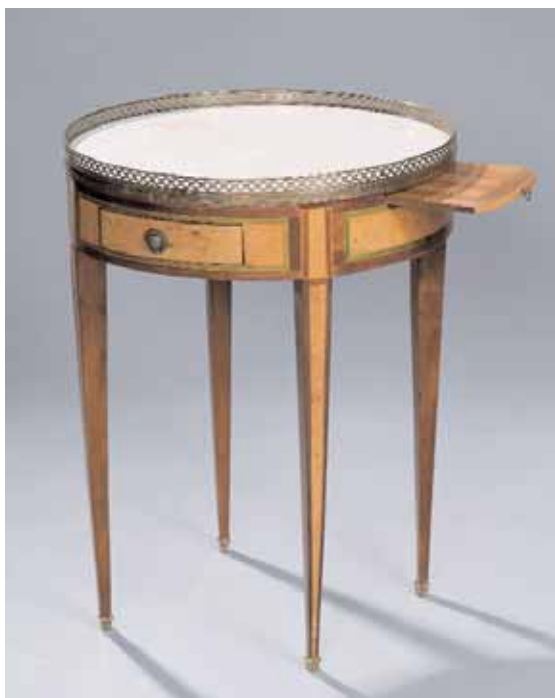
Guéridon de bouillotte en placage d'érable, amarante et citronnier teinté. Il ouvre à deux tiroirs et deux tirettes latérales Epoque Louis XVI H. 80,5 cm Diamètre : 60 cm (restauration d'usage) 4.000/6.000