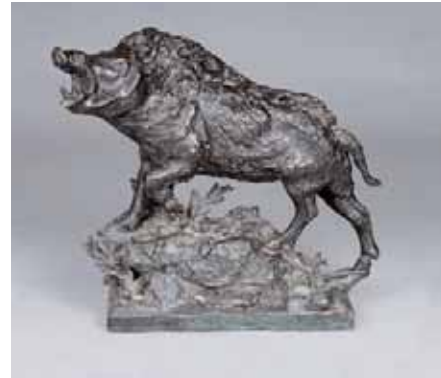
LECOURTIER Prosper (1855-1924/25) Sanglier Bronze à patine verte foncée signé H. 42 x L. 42 cm 2.000/2.500