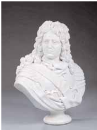
Important buste en marbre représentant Louis XIV H. 74 x L. 60 cm 3.000/4.000