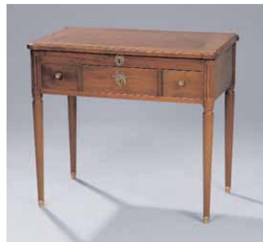
Table bureau formant coiffeuse en acajou et placage d'acajou Epoque Louis XVI H. 72,5 x L. 80 x P. 48 cm 1.500/2.000