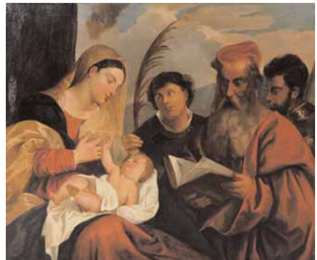
D'après LE TITIEN La Vierge à l'enfant avec St Etienne, St Jérôme et St Maurice Huile sur toile 107 x 133 cm 2.500/3.000 L'original se trouvant au musée du Louvre.