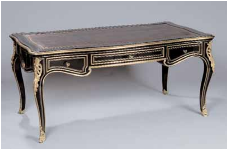
Très beau bureau plat en placage de poirier noirci ouvrant à trois tiroirs en palissandre Belle ornementation de bronze doré et ciselé Garniture de cuir doré au petit fer à entourage de laiton doré Style Régence, Napoléon III H. 74 x L. 62 x P. 86,5 cm 10.000/13.000