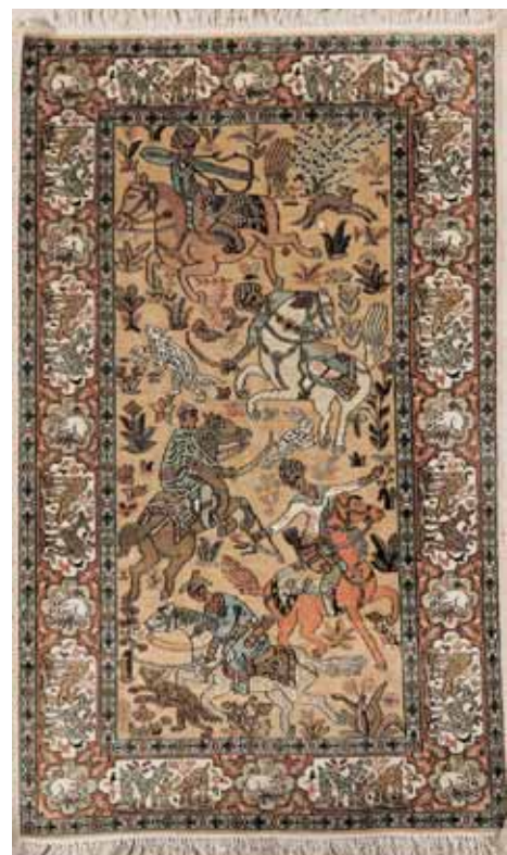
KASHMIR Laine et soie Chasse persane 155 x 93,5 cm 800/1.200