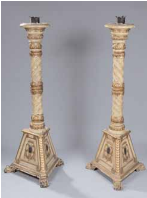
Paire de porte-torchères en bois laqué or. Colonnes torses, piètement triangulaire. Pieds griffes Italie, XIXème siècle Hauteur : 187 cm