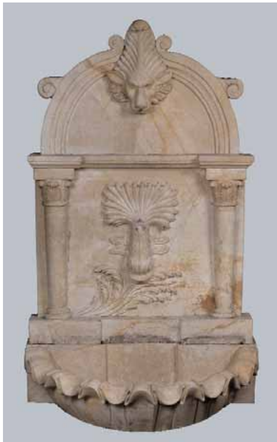
Importante fontaine en marbre à décor de tête de lion et dauphin encadré de demi-colonnes Début XXème siècle H. 172 x L. 98,5 x P. 70 cm 3.500/4.500