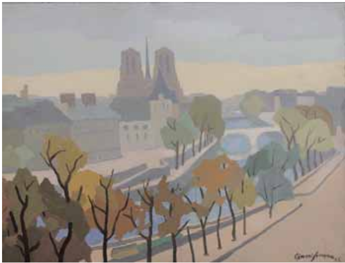
Clément SERVEAU Notre-Dame Huile sur toile, signée en bas à droite et datée 48 50 x 65 cm 1.500/2.000