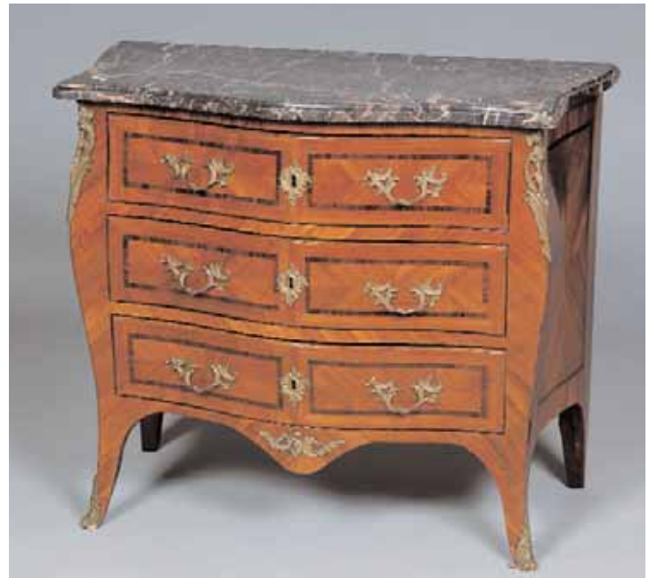
Commode en marqueterie de bois de rose. Epoque Louis XV. Estampillée MACRET H. 82 x L. 92 x P. 42,5 cm 6.000/8.000