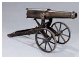
Petit canon XIXème siècle H. 39 x L. 90 x P. 41 cm 4.000/5.000