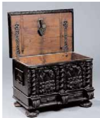
Coffre richement sculpté. Il ouvre par le dessus découvrant une très belle serrure d'origine et un tiroir en partie basse Début du XVIIIème siècle H. 57 x L. 82 x P. 51,5 cm (quelques restaurations d'usage) 1.500/2.000