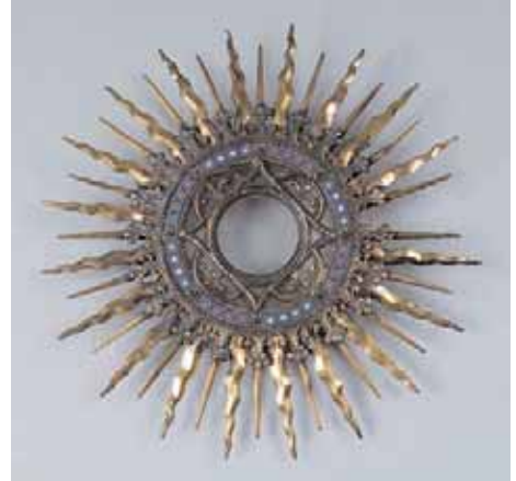
Soleil à entourage d'émaux. Les rayons du soleil en laiton. Cadre intérieur en vermeil Travail étranger, XIXème siècle Diamètre : 39 cm 1.500/1.800