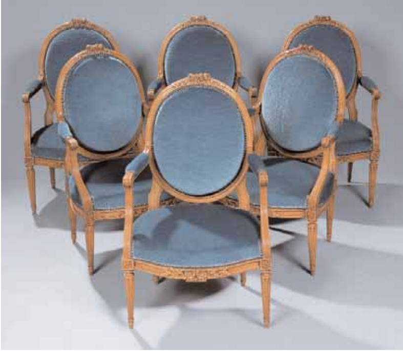
Rare suite de six fauteuils en hêtre à dossiers médaillons, moulurés et sculptés de fleurs et rubans Estampillés JACOB Epoque Louis XVI H. 98 x L. 65 x P. 61 cm