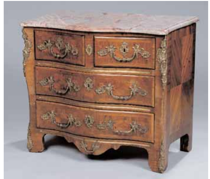
Commode en marqueterie ouvrant à trois rangs de tiroirs. Belles poignées en bronze. Estampillée François FLEURY. Epoque Régence H. 83 x L. 95 x P. 55 cm (quelques petites restaurations) 7.000/8.000