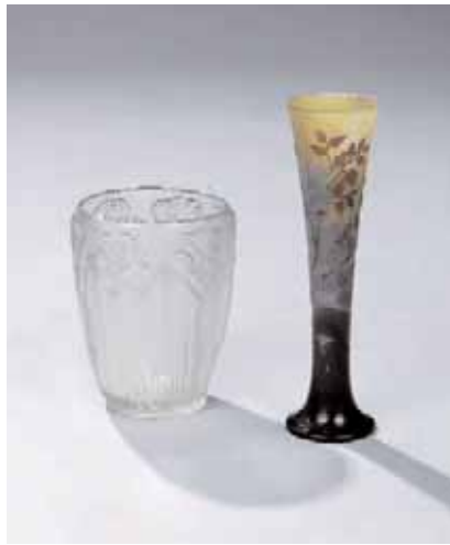
GALLE. Vase en pâte de verre Décor de branches fleuries H. 28,5 cm 1.800/2.000 LALIQUE. Vase « DANAÏADES » Verre blanc moulé-pressé, patiné opalescent (pied meulé). Modèle créé le 16 mars 1926, reproduit dans le catalogue raisonné "R. Lalique" par Félix Marcilhac. H. 18,5 x L. 14 cm 2.000/2.500