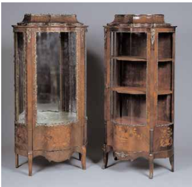
Deux vitrines en bois de placage marqueté de fleurs Vers 1880 H. 166 x L. 78 x P. 52 cm (seront divisées) 2.000/2.500 chaque