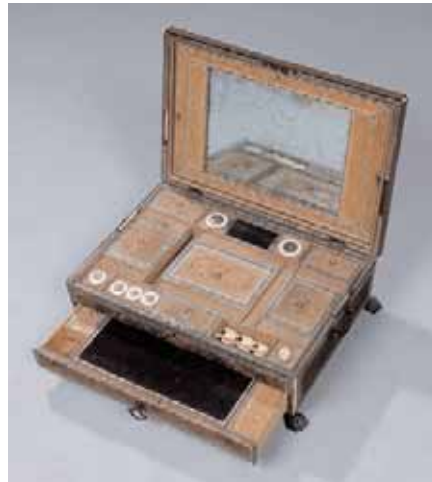
Boîte à ouvrage formant écrioire Finement décorée d'ivoire, bois sculpté d'animaux exotiques et de fleurs Travail anglais du XIXème siècle pour les Indes H. 19 x L. 47 x P. 32 cm 2.000/2.200