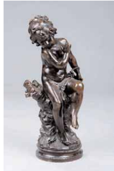
Auguste MOREAU Enfant au panier de raisins. Bronze à patine brune, signé. H. 65 cm 2.000/3.000