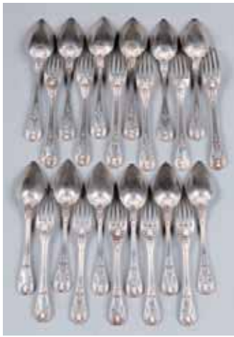
Dix fourchettes et douze cuillères en argent Epoque Restauration Poids : 1.261 g. 1.000/1.200