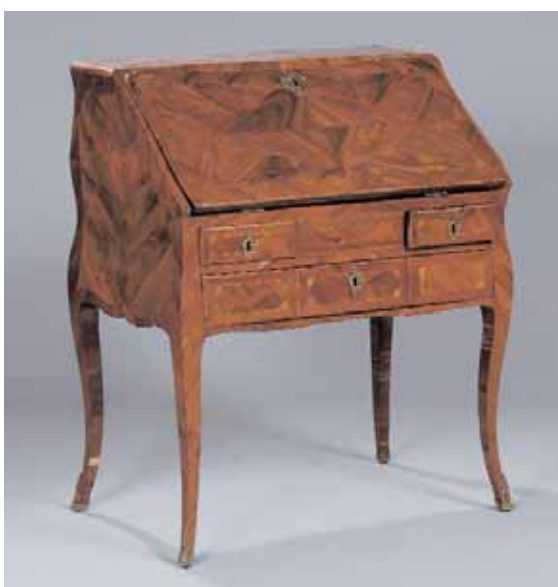
Bureau de pente toute face et galbée en placage de bois de rose et amarante Il ouvre à un abattant découvrant six tiroirs Epoque Louis XV H. 100 x L. 51 x P. 82 cm 5.000/6.000