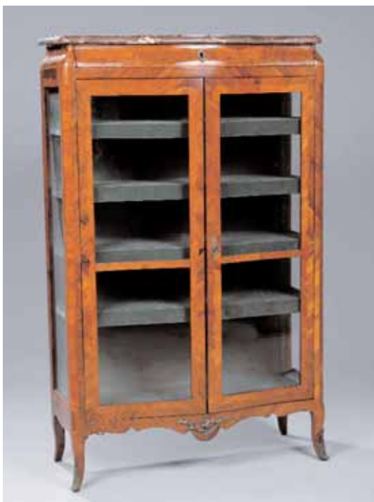
Très belle vitrine en placage de bois de rose Elle ouvre par un tiroir en partie haute en forme de doucine et deux portes vitrées Transition des Epoque Louis XV et Louis XVI H. 159 x L. 65,5 x P. 39 cm (petites restaurations) 4.000/5.000