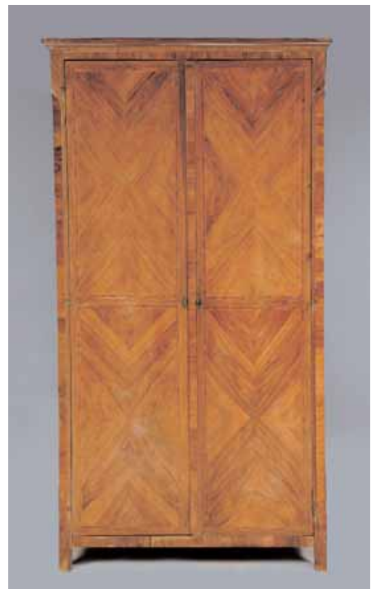
Rare armoire en placage de bois de rose en ailes de papillon Serrures et crémons d'origine Estampillée B. DURAND dit BONDURAND Epoque Louis XVI H. 228 x L. 121 x P. 43 cm 7.000/8.000