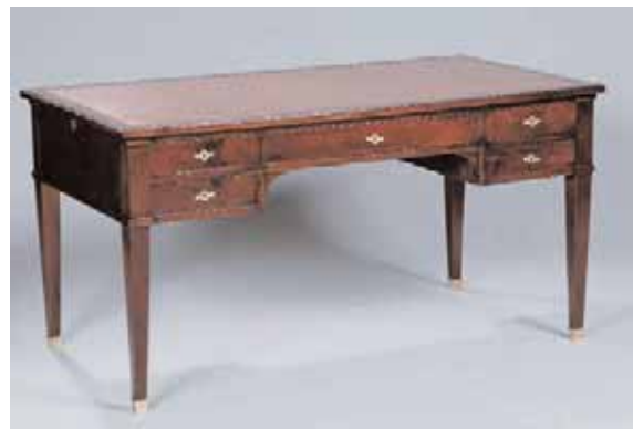
Bureau en acajou et placage d'acajou Epoque Restauration H. 75 x L. 147 x P. 77 cm 2.000/3.000