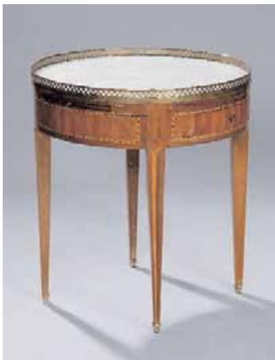
Guéridon de bouillotte en placage d'érable, amarante et citronnier teinté. Il ouvre à deux tiroirs et deux tirettes latérales Epoque Louis XVI H. 67,5 cm Diamètre : 59,5 cm (restauration d'usage) 2.000/2.500