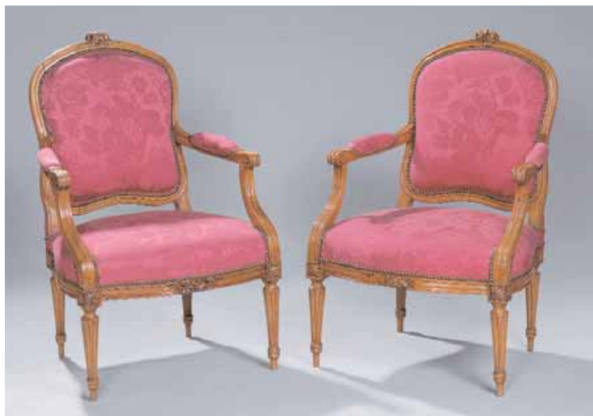
Paire de fauteuils à dossiers plats en hêtre, moulurée et sculptée de fleurs Pieds cannelés Epoque Louis XVI H. 97 x L. 62 x P. 67 cm 5.000/6.000