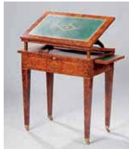
Table d'architecte en bois de placage.