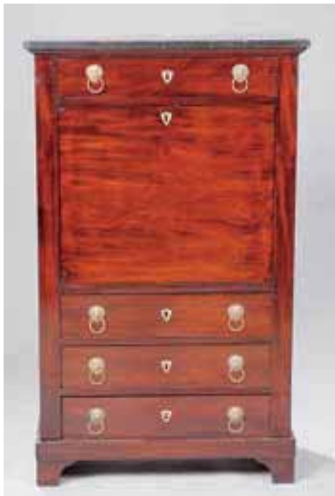
Secrétaire en acajou et placage d'acajou. Il ouvre par un tiroir, un abattant et trois tiroirs. Dessus de marbre. Epoque Directoire. H. 138 x L. 84 x P. 40,5 cm