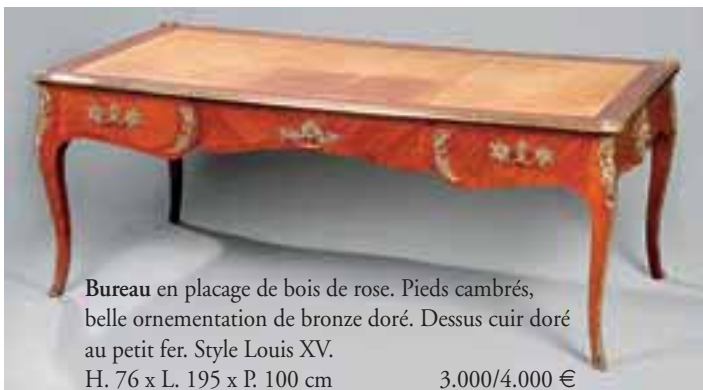
Bureau en placage de bois de rose. Pieds cambrés, belle ornementation de bronze doré. Dessus cuir doré au petit fer. Style Louis XV. H. 76 x L. 195 x P. 100 cm 3.000/4.000 €