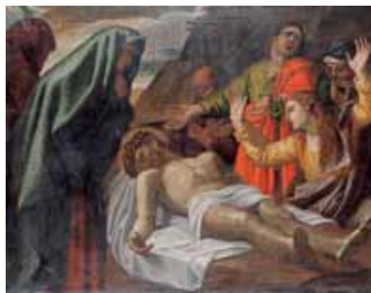
Ecole Française vers 1850. La déploration sur le Christ mort. Toile 99 x 127 cm 2.000/3.000 €