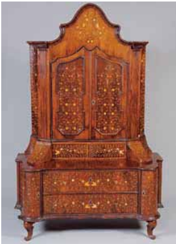
Exceptionnel scriban à deux corps formant commode. Il ouvre par deux portes et deux tiroirs en partie supérieure et deux tiroirs et deux portes latérales. Marqueterie de noyer et bois clair. Venise XVIIIème siècle. H. 235 x L. 158 x P. 67 cm 8.000/10.000 €