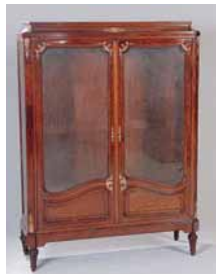
Vitrine en acajou à deux portes vitrées doublées d'un grillage. Epoque Napoléon III H. 166,5 x L. 119 x P. 42 cm 3.500/4.500 €