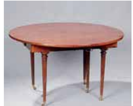
Table à abattant en acajou et placage d'acajou. Elle pose sur six pieds. Epoque Louis XVI. H. 70 x L. 126,5 x l. 126,5 cm 2 allonges en placage d'acajou. (un petit manque) 2.000/3.000 €