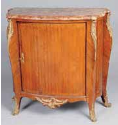
Meuble d'entre-deux à rideaux. Estampillé DUBOIS. Epoque Louis XV. H. 92 x L. 96 x P. 43 cm 6.000/8.000 €