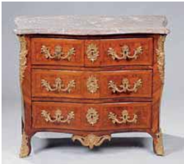
Commode à façade légèrement galbée. Elle ouvre à trois rangs de tiroirs. Epoque Louis XV. Dessus de marbre. H. 84 x L. 104 x P. 55,5 cm. (restaurations d'usage)