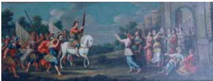
Ecole Italienne du XVIIème siècle, suiveur de Johan Henrich SCHONFELD.

L'entrée triomphale de David à Jérusalem.