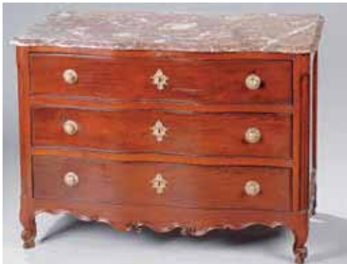
Commode en acajou, façade arbalète. Elle ouvre à deux tiroirs. XVIIIème siècle. Dessus de marbre. H. 92 x L. 128 x P. 65 cm. (pieds arrières anté.)