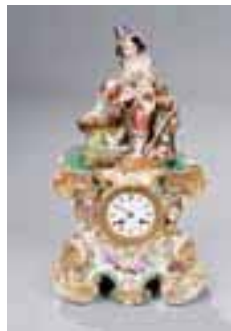
Pendule en porcelaine de Paris dans le goût de Jacob Petit. XIXème siècle. (accident) H. 50 x L. 28 cm. 500/600 €