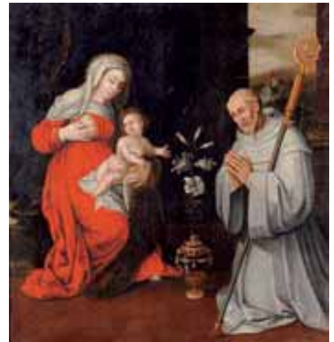
Ecole Flamande du XVIIème siècle. La lactation de Saint-Bernard. Toile 112 x 107 cm 2.000/3.000 €