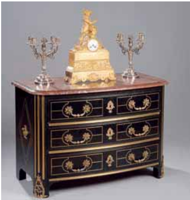
Pendule en bronze doré, dite au « Mousquetaire ». Epoque Restauration. H. 58 x L. 42 x l. 15 cm 2.500/3.500 € Commode en bois de placage ouvrant à trois tiroirs. Dessus de marbre. Style Louis XIV. H. 81 x L. 120 x P. 61 cm 4.000/5.000 € Paire de candélabres en bronze argenté à quatre bras de lumières. H. 37 cm 1.000/1.500 €