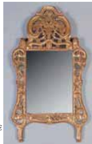
Glace en bois doré à réserves. Epoque Louis XV. H. 115 x L. 61 cm (petit accident) 1.000/1.500 €