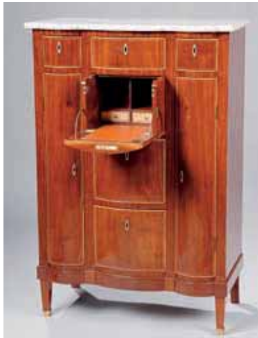
Meuble à façade arbalète à trois tiroirs, une porte, deux vantaux et un abattant découvrant un écritoire. Fin XVIIIème siècle. H. 133 x L. 90,5 x P. 47,5 cm. (restaurations d'usage)