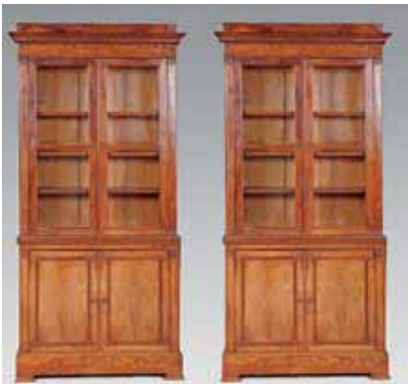
Paire de vitrines en bois de placage ouvrant à deux portes vitrées et deux vantaux. 1ère moitié du XIXème siècle.

Vers 1880. H. 120 x L. 80 cm 5.000/6.000 €