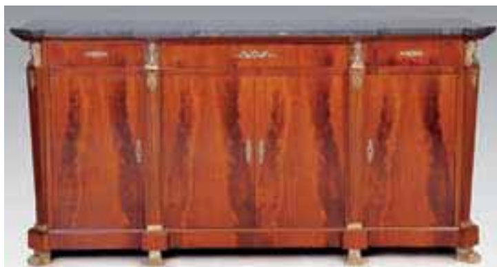
Enfilade en acajou et placage d'acajou. Belle ornementation de têtes d'Egyptiennes. Pieds griffés. Dessus de marbre. Style Retour d'Egypte. H. 106 x L. 204 x P. 58 cm 4.000/6.000 €