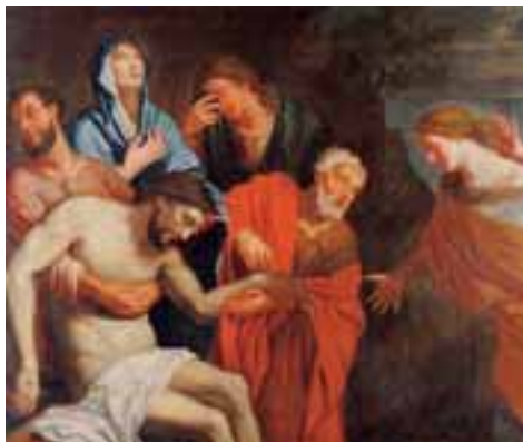
Ecole Française du XVIIème siècle. La descente de croix Toile 107,5 x 128 cm 2.000/3.000 €