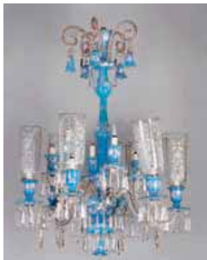
Important lustre à douze bras de lumière en opaline et cristal de Baccarat. Décor de fleurettes peintes, riche ornementation de pampilles sur les collerettes.

Vers 1880. H. 120 x L. 80 cm 5.000/6.000 €