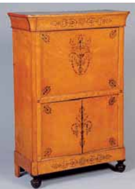
Secrétaire à abattant en placage d'érable moucheté et marqueterie d'amarante. Epoque Charles X. (manque le marbre) 2.000/3.000 €