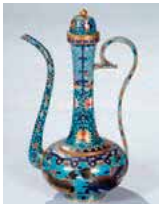
Samovar en émaux cloisonnés polychromes et bronze doré au mercure, ornée de motifs floraux tapissant et de quatre «Kilins» sur la panse. Pieds en couronne marquée à la base d'un cachet calligraphique Nien Ha CHINE Dynastie QING. XIXe siècle. H. 37 cm.