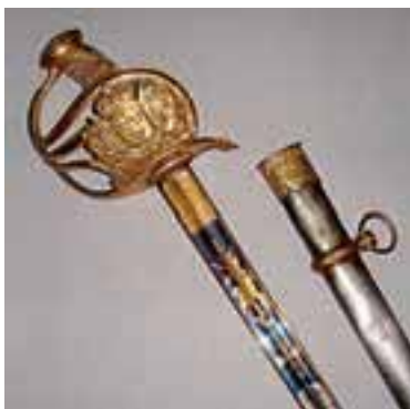
Sabre d'officier de garde du corps du Roi. Garde en laiton doré aux armes de France, fusée recouverte de galuchat à double filigrane en cuivre; lame droite losangée à double gorge, dorée et bleuie sur la moitié, signée : «Manufure de Klingenthal - Coulaux frères». Long. 107cm. (Filigrane incomplet). Epoque Restauration. Très bon état. 4 000/5 000 €