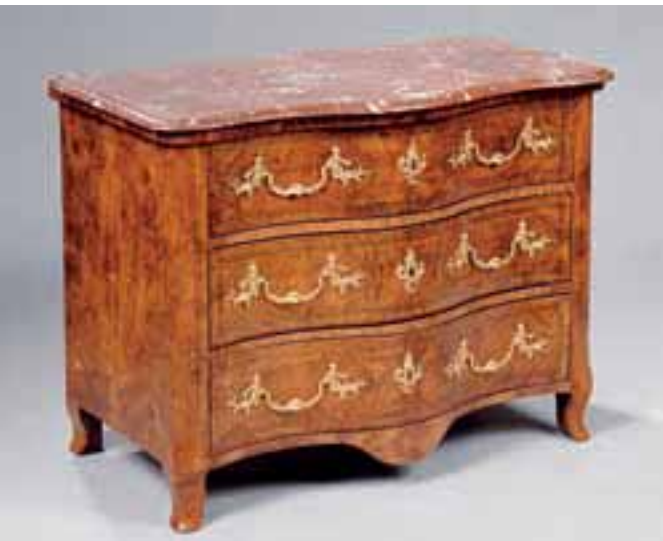
Commode galbée en placage de loupe de thuya à trois tiroirs. Dessus de marbre. Travail de la région du Dauphiné XVIIIème siècle. H. 78 x L. 101 x P. 59 cm (restaurations d'usage et remise en état) 8.000/10.000 €