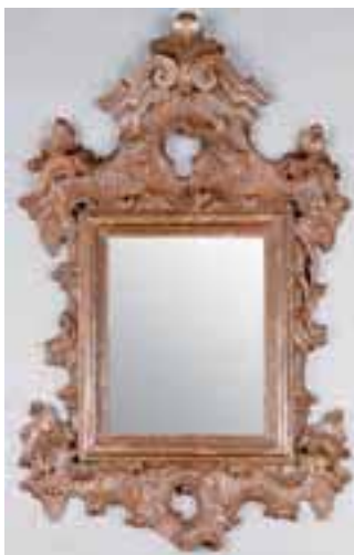
Miroir en bois sculpté.

H. 277,5 x L. 115 x P. 51 cm. (petits accidents) 2.000/3.000 €