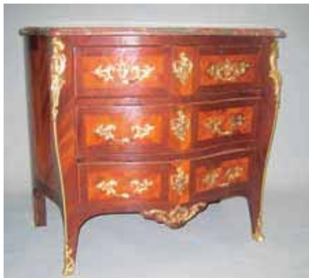
Commode en marqueterie. Estampillée Fromageau. Epoque Louis XV. H. 81 x L. 94 x P. 58 cm