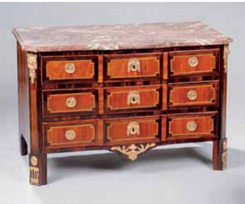
Commode en bois de placage, bois de rose, amarante et citronnier teinté à trois rangs de tiroirs. Transition des Epoques Louis XV – Louis XVI. Dessus de marbre.