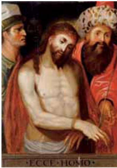
Ecce Homo Panneau parqueté 106 x 77 cm 2.000/3.000 €