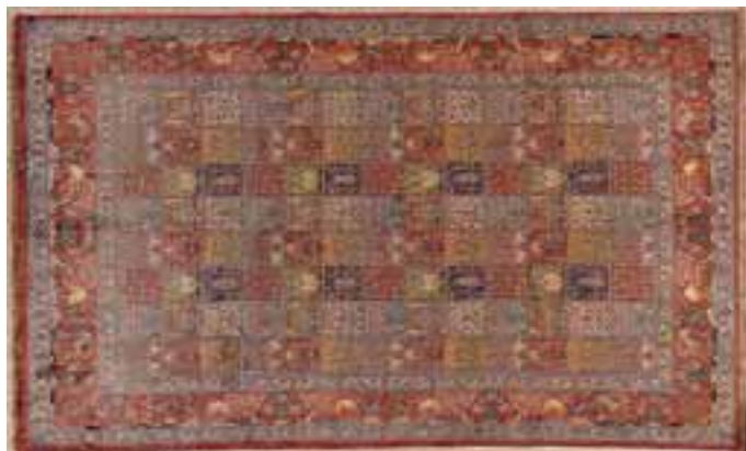
GHOUM laine et soie.