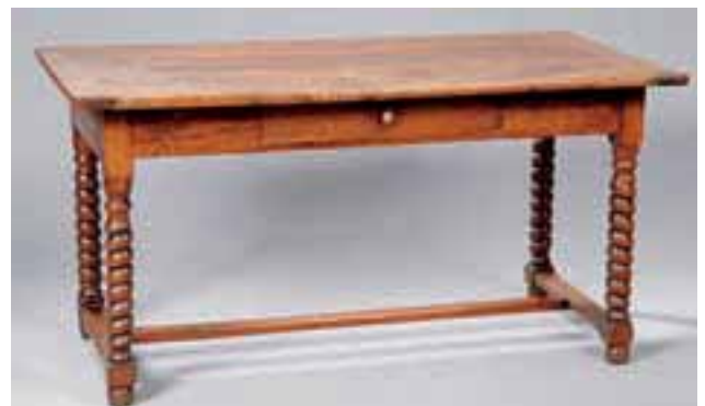
Table de salle à manger en bois naturel. Elle ouvre à un tiroir en ceinture. Milieu XVIIème siècle. H. 77 x L. 150 x P. 77 cm. (restaurations d'usage) 1.300/1.700 €