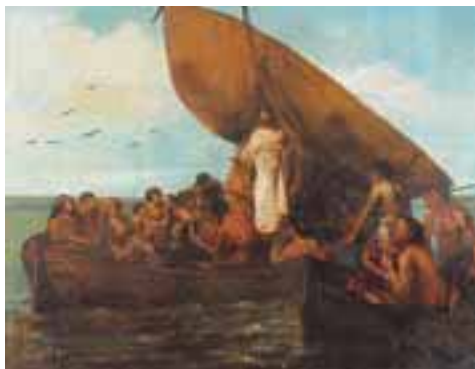
Ecole Française vers 1850. Jésus prêchant sur les eaux. Toile 105 x 135 cm 2.000/3.000 €