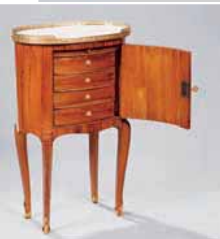
Table de salon ovale en placage.

Reprise du tableau conservé à la National Gallery de Londres.