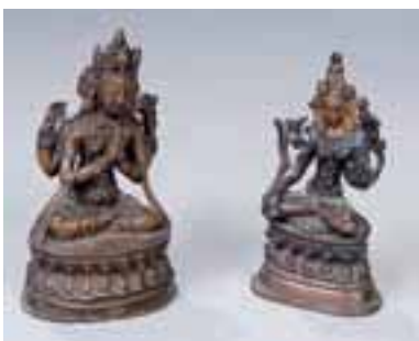
PADMAPANI « le porteur de lotus » , dans la forme Avalokitesvara assis en Dyanasana. Bronze. TIBET XVIIe-XVIIIème siècle. 1.000/1.500 €