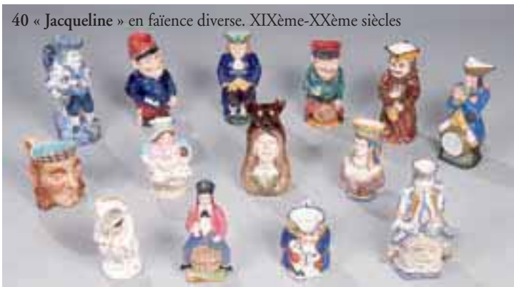
40 « Jacqueline » en faïence diverse. XIXème-XXème siècles