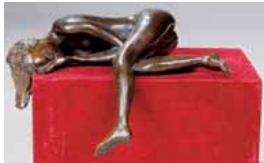
ISADORIEL. XXème siècle.