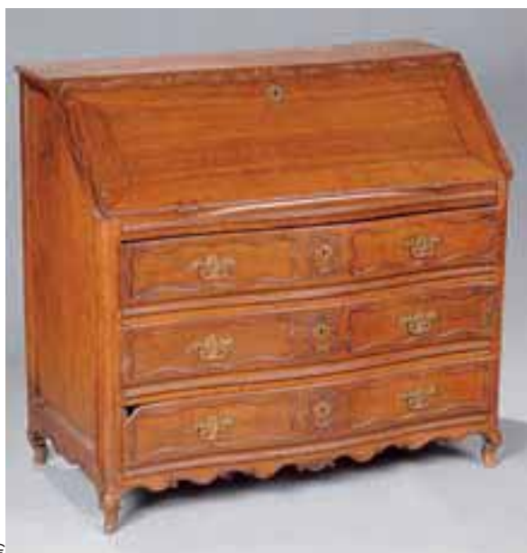
Bureau de pente en chêne formant commode. Façade galbée à trois tiroirs. XVIIIème siècle. H. 111,5 x L. 121 x P. 59 cm. (restaurations) 5.000/6.000 €