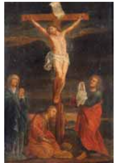
Ecole Française du XVIIème siècle. La crucifixion Toile. 110 x 76 cm (accidents et manques) 1.500/2.000 €