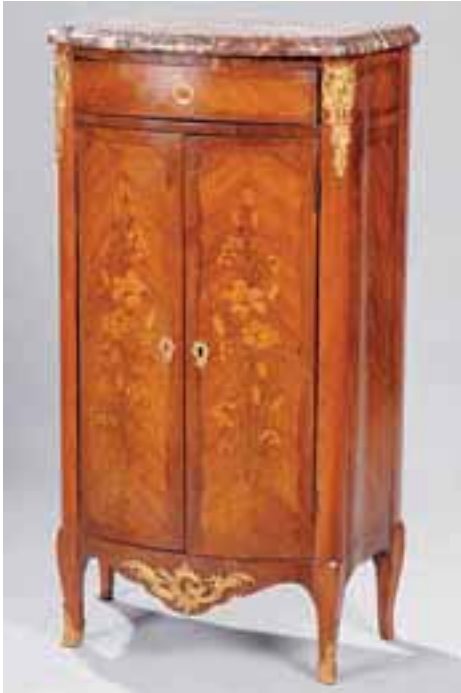
Secrétaire à deux vantaux marquetés. Il découvre tiroirs, casiers et tirettes.

Côtés galbés. Dessus de marbre. Transition des Epoques Louis XV-Louis XVI. H. 121 x L. 67,5 x P. 38 cm 7.000/8.000 €