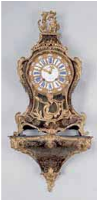
Cartel en placage d'écaille et laiton. Belle ornementation de bronze doré. Epoque Régence. Haut. avec son cul : 120 cm