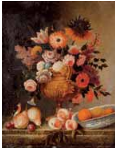
Ecole Française vers 1820, dans le goût de Jean Baptiste Monnoyer. Bouquet de fleurs sur un entablement. Toile 2.000/3.000 €