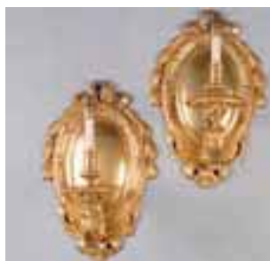
Paire d'appliques à un bras de lumière en bronze doré.

Côtés galbés. Dessus de marbre. Transition des Epoques Louis XV-Louis XVI. H. 121 x L. 67,5 x P. 38 cm 7.000/8.000 €