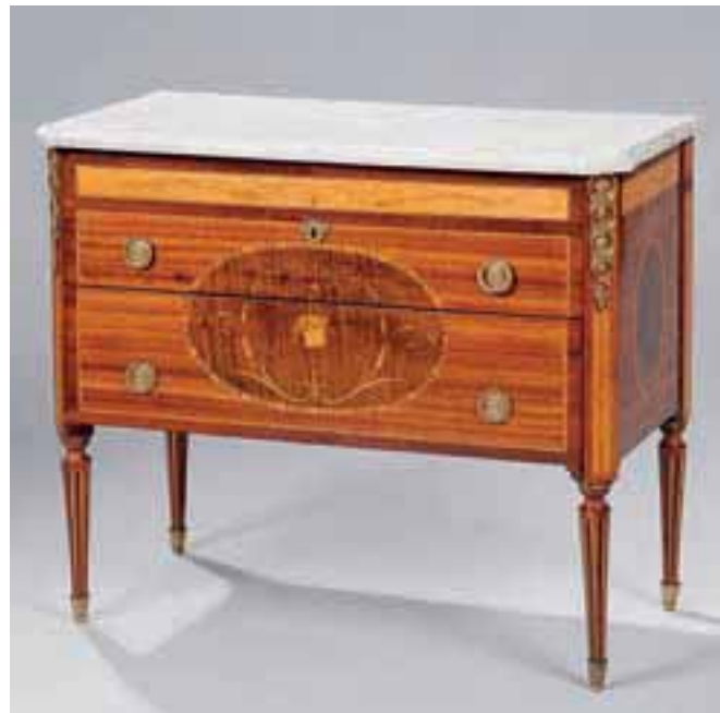
Commode en bois de placage marquetée d'un médaillon au panier fleuri à deux tiroirs sans traverse.