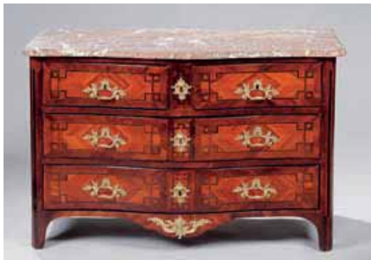
Commode galbée en bois de placage à trois rangs de tiroirs. Epoque Régence. Dessus de marbre. H. 84,5 x L. 130 x P. 63 cm