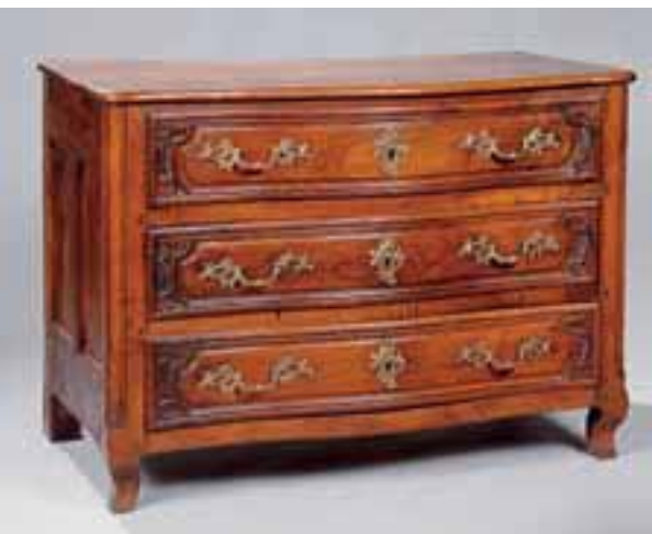
Commode en noyer. Façade galbée à trois tiroirs. XVIIIème siècle.