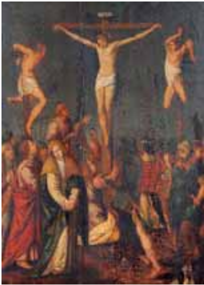
Ecole Flamande vers 1650, suiveur de Ambrosius FRANCKEN. Le Golgotha. Panneau. 60 x 46 cm. (manques et fentes). 3.000/4.000 €