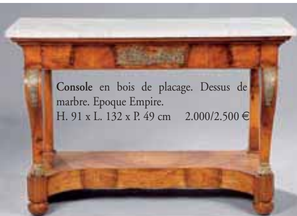
Console en bois de placage. Dessus de marbre. Epoque Empire. H. 91 x L. 132 x P. 49 cm 2.000/2.500 €