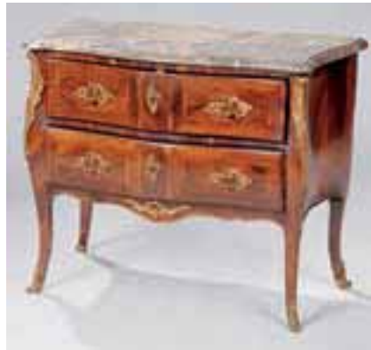
Commode en bois de placage, façade galbée ouvrant à deux tiroirs. Dessus de marbre. Epoque Louis XV. H. 81 x L. 100 x P. 46 cm 4.000/5.000 €