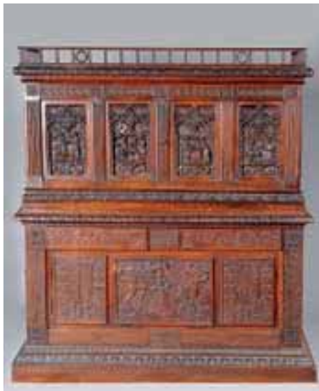
Cabinet richement sculpté. XVIIème siècle. H. 179 x L. 156 x P. 69 cm. (restaurations d'usage) 2.500/3.000 €