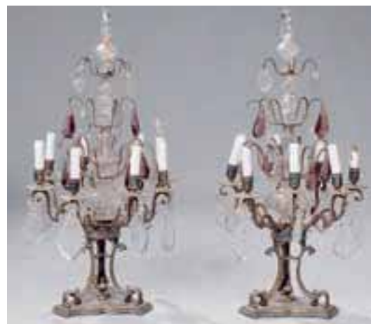
Paire de girandoles en bronze à pendeloques de cristal à huit lumières. H. 79 cm – Diam. 39 cm. (acc. boule du haut) 2.000/2.500 €

Ménagère 167 pièces en argent comprenant 24 couverts de table, 18 couverts à dessert, 17 cuillères à café, 1 pince à sucre, 1 saupoudreuse, 16 couteaux à fruit en vermeil, 24 couteaux à dessert, 24 couteaux de table. Modèle baguette avec médaillon ciselé « nid d'abeille ». M.O. HENIN. 7700 g. Meuble sur pied 5 tiroirs. 8.000/10.000 €