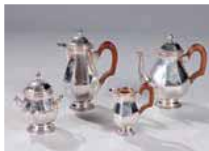
Service quatre pièces à pans en argent. 2215 g 2.000/2.200 €