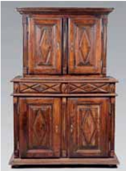
Buffet deux corps en noyer à quatre portes et deux tiroirs. Fin XVIIème siècle. H. 208 x L. 145,5 x P. 62 cm. (quelques restaurations) 2.000/2.500 €