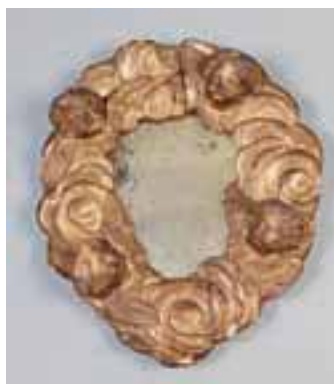
Glace de forme ronde en bois doré à décor de têtes d'enfants.