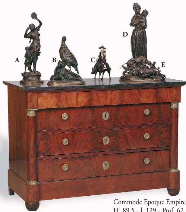
Commode Epoque Empire. H. 89,5 - l. 129 - Prof. 62 cm