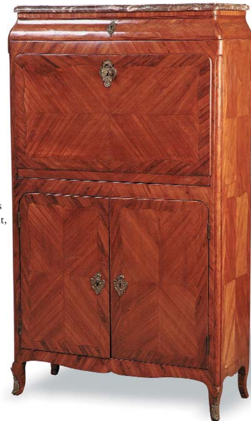
Secrétaire en placage de bois de rose un tiroir, un abattant, deux vantaux. Epoque Transition. (remise en état) H. 167 cm l. 95 cm P. 38 cm