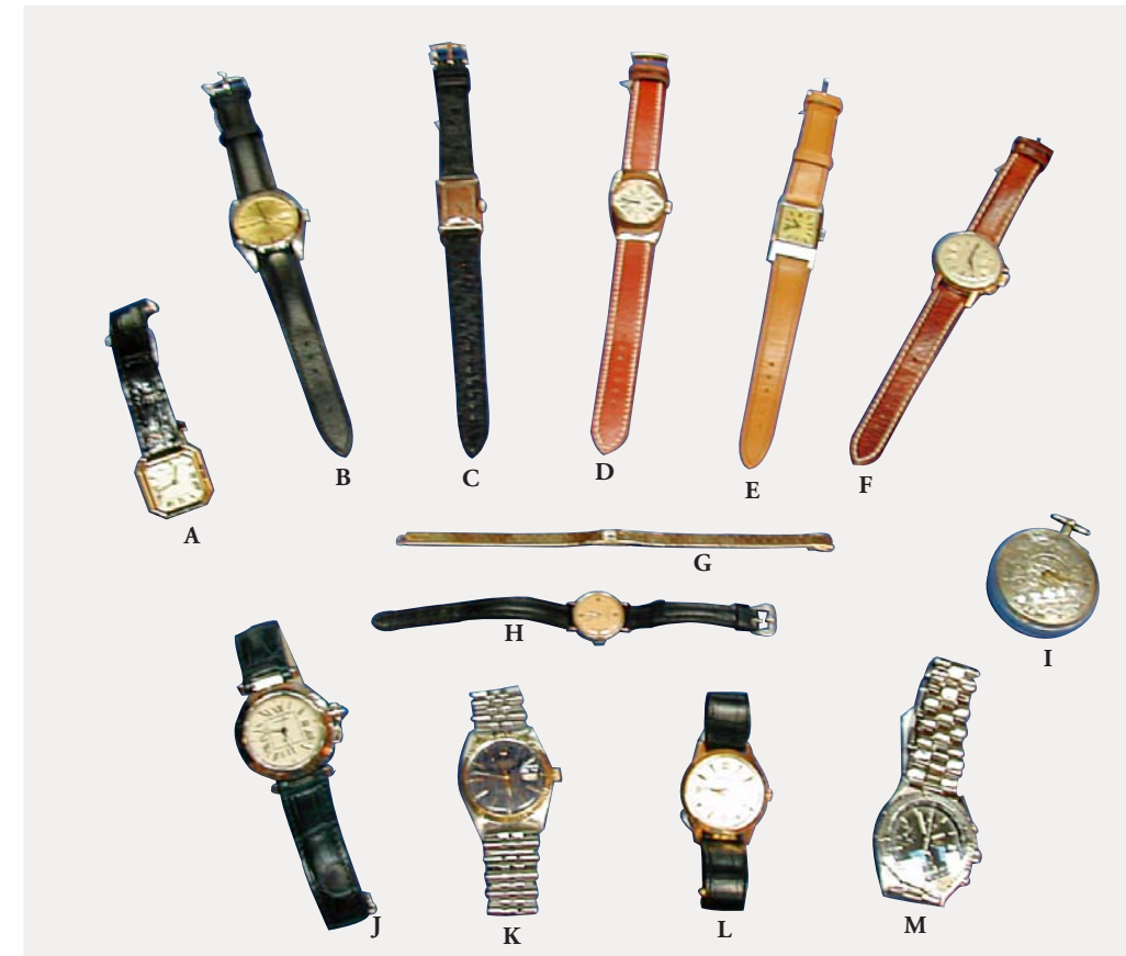
A- CARTIER « ceinture » en or vers 1980. B- ROLEX « oyster-date » vers 1979 C- CARTIER en or vers 1940. D- KIRBY-BEARD en or « olive » 1980 E- OMEGA vers 1940. F. BREITLING vers 1940. G- JAEGER LECOULTRE en or « calibre 101 » vers 1934 H- PATEK PHILIPPE or et acier vers 1940. I- TART XVII e siècle – montre au coq en argent à quatrième J- CARTIER « Pasha » vers 1990. K- ROLEX « date just » vers 1985. L- JAEGER LECOULTRE vers 1950 M- BREITLING en or « chronomat » vers 1990.