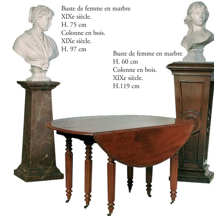
Buste de femme en marbre XIX e siècle. H. 75 cm Colonne en bois. XIX e siècle. H. 97 cm