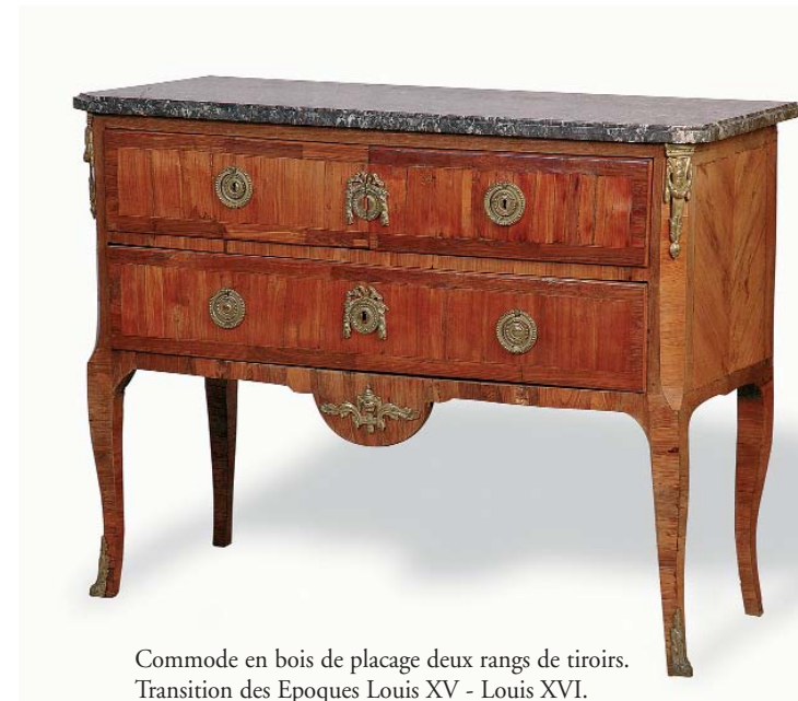
Commode en bois de placage deux rangs de tiroirs. Transition des Epoque Louis XV - Louis XVI. H. 88 - l. 111 - Prof. 48 cm