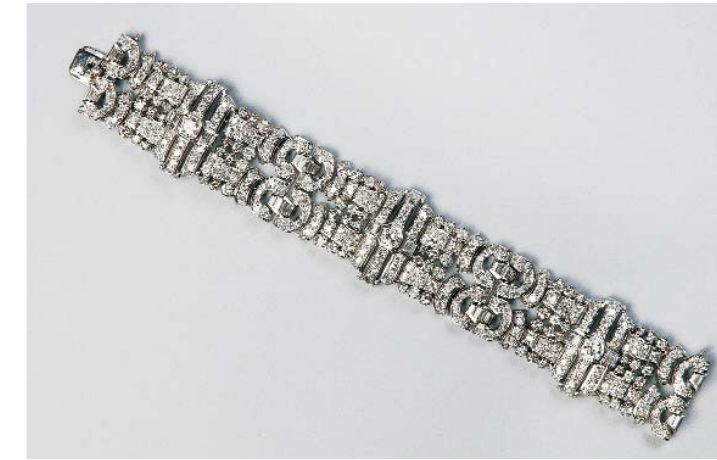
Bracelet des années 1930, pavé de brillants et de diamants. Monture or gris. Diamants : 20 cts. Poids : 69,2 g