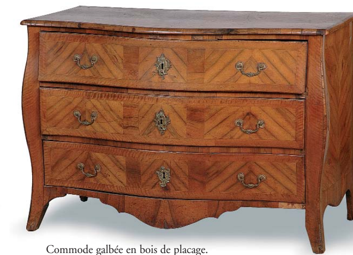
Commode galbée en bois de placage. XVIII e siècle. H. 85 - l. 120 - prof. 63 cm