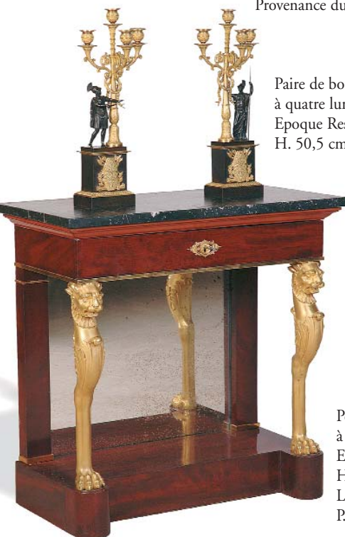
Paire de bougeoirs à quatre lumières en bronze doré. Epoque Restauration. H. 50,5 cm