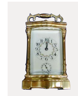
Pendulette de bureau en laiton. Mouvement mécanique à répétition. Vers 1880.