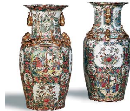
Vases en porcelaine de Canton. Début XX e siècle. H. 92 cm