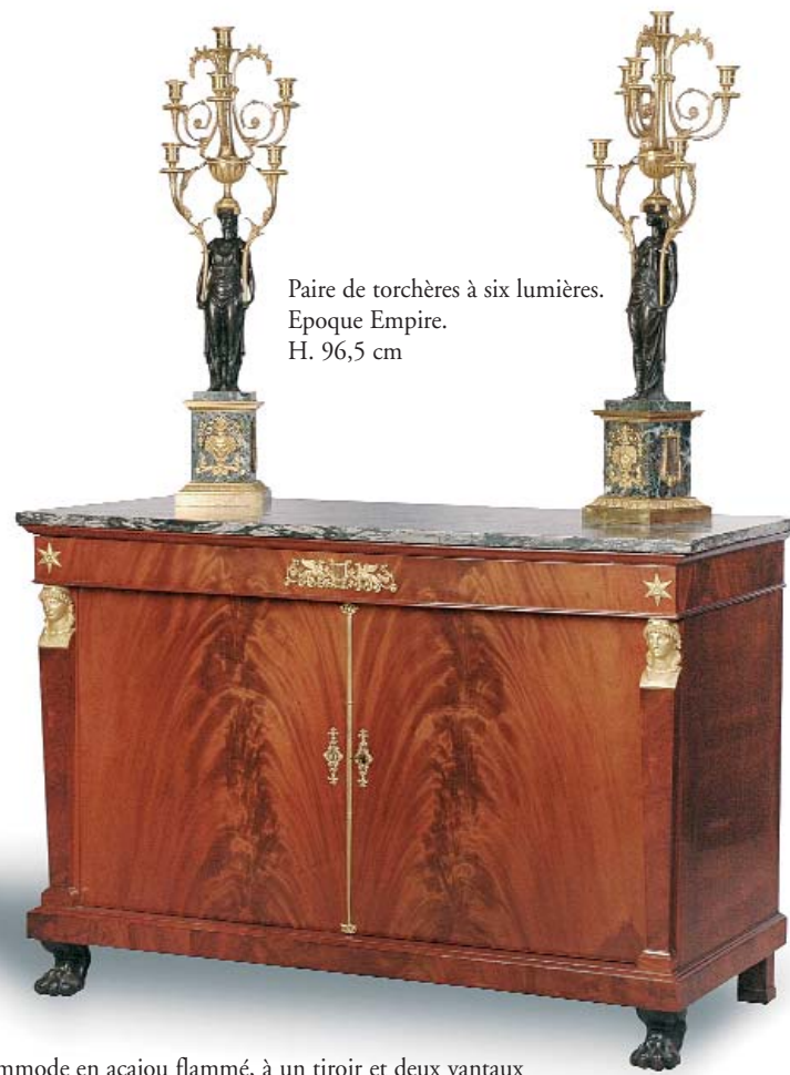
Paire de torchères à six lumières. Epoque Empire. H. 96,5 cm