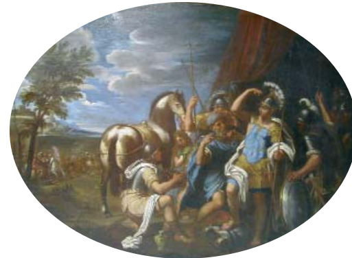
Ecole Française du XVII ème siècle, suiveur de Lebrun. "La blessure d'Achille" Huile sur toile ovale. 105 x 108 cm