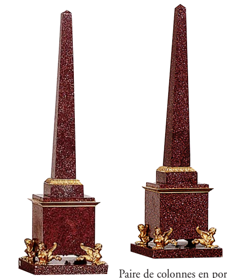
Paire de colonnes en porphyre d'Égypte. XIX e siècle H. 84 cm - l. 24.5 cm