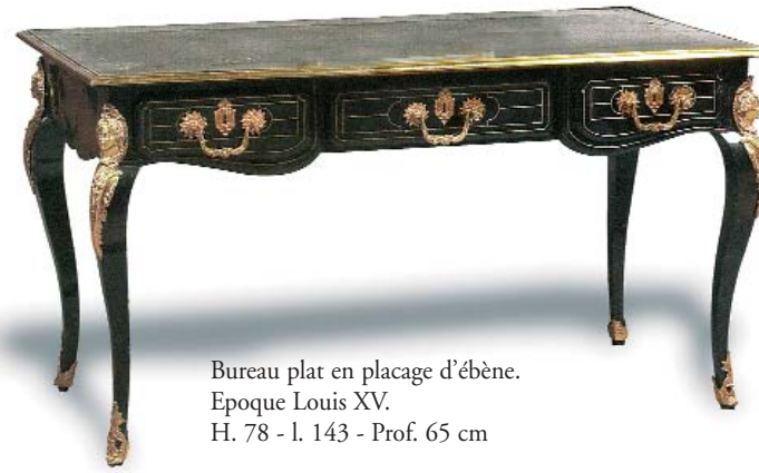
Bureau plat en placage d'ébène. Epoque Louis XV. H. 78 - l. 143 - Prof. 65 cm