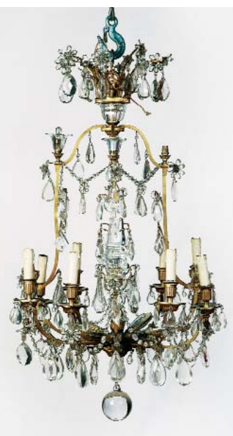
Lustre à pendeloques début XXe siècle. H. 112 - Ø : 62 cm