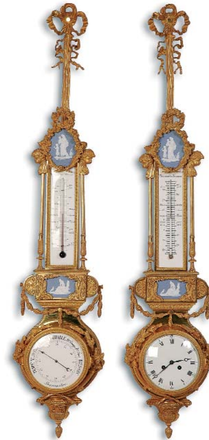
Paire de baromètres-thermomètres-pendules, en bronze doré. Modèle de BEURDELEY. XIX ème siècle.