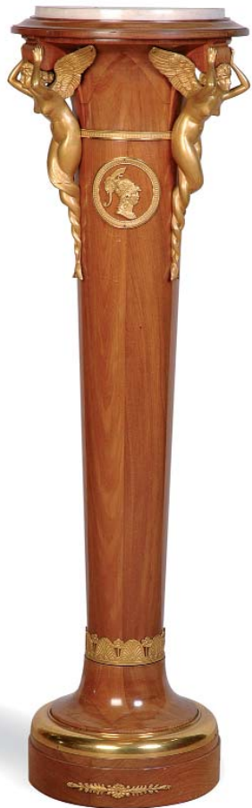
Colonne à décor de sirène ailée. Epoque Restauration. Modèle de WEISWEILER H. 141 cm - Ø 40 cm