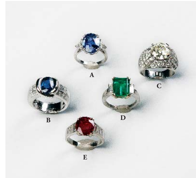
A- Bague saphir. 4,30 cts. B- Bague saphir. 2,24 cts et 2cts de brillants env. Signée Chaumet. C- Bague ornée d'un brillant de 3,20 cts. Poids : 12,69 g. D- Bague émeraude. 4,10 cts. E- Bague rubis. 2,20 cts.

EXPOSITIONS PUBLIQUES Vendredi 23 juillet de 14h à 18h Samedi 24 juillet de 10h à 12h et de 14h à 18 h