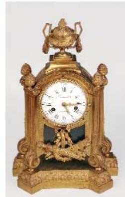
Pendule en bronze doré. Epoque Louis XVI. Cadran de LIOTAUD à Paris. Provenance du Château de Plancouet.