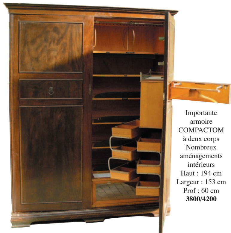
Importante armoire COMPACTOM à deux corps Nombreux aménagement intérieurs Haut : 194 cm Largeur : 153 cm Prof : 60 cm 3800/4200