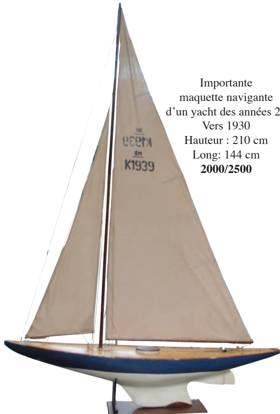
Importante maquette navigante d'un yacht des années 20 Vers 1930 Hauteur : 210 cm Long: 144 cm 2000/2500