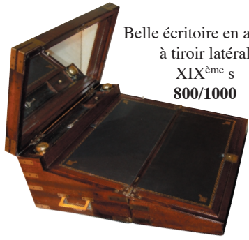
Belle écritoire en acajou à tiroir latéral XIX ème s 800/1000