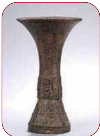
Lot n° 105 1 000/1 500 € Vase à vin de forme Gu. Bronze. Chine. Dynastie Shang. 16ème à 11ème siècle avant JC. 21,5 cm.