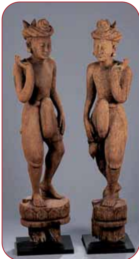
Lot n° 193 5 000/6 000 € Paire de porteurs de Gong. Bois. Royaume de Mandalay. Birmanie. 18ème s. 130 cm.