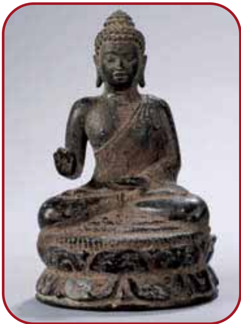
Lot n° 194 6 000/8 000 € Bouddha en dhyanasana Bronze, airain. Royaume de Majapahit. Java Est. Indonésie. 12ème /14ème. H 17x L 10,5 cm