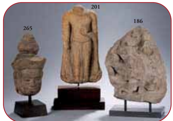
Lots n°265, 201, 186 Statuaire et hauts reliefs de temple. Pierre et terre cuite. Khmer. Cambodge. 8ème à 13ème.