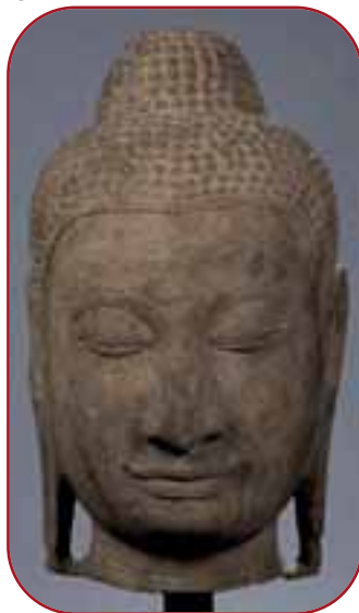
Lot n° 197 6 000/7 000 € Tête de Bouddha. Pierre grès gris. Royaume de U Thong. Thaïlande. 15ème. 50 cm.