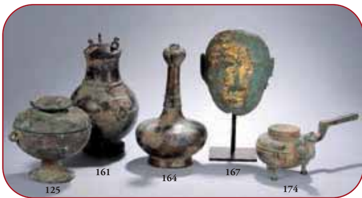
Lots n° 125, 161, 164, 167, 174 Bronze d'archéologie. Chine. 7ème avant JC à 2ème siècle avant JC.