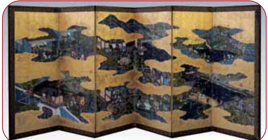
Lot n° 288 4 500/5 000 € Paire de paravents à 6 feuilles à la feuille d'or. Japon. Fin 19ème siècle. 374x171cm