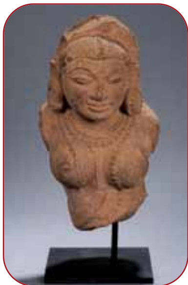
Lot n°237 3 500/4 000 € Buste de Parvati. Pierre grès beige. Inde. Vallée du Gange. Dynastie Chandella. 9ème à 11ème 35cm.