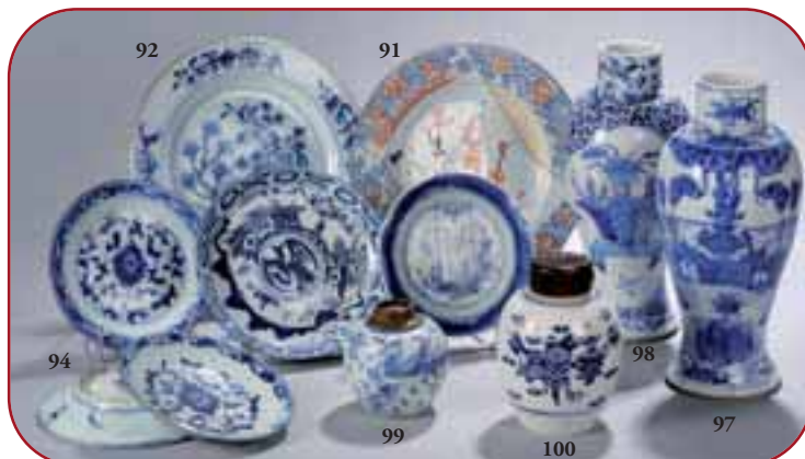
Lots n° 94, 92, 99, 91, 100, 97 Porcelaines de Chine. Dynasties Ming et Qing. 17ème à 19ème siècles.