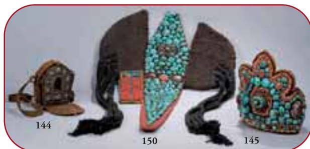
Lots n°144, 150, 145 Parures et objets rituels. Ladakh et Tibet