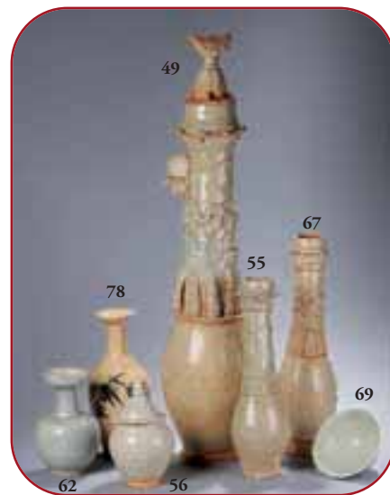
Lots n° 62, 56, 78, 49, 55, 67, 69 Porcelaines, céladon, Qinbai et Cizhu. Chine. Dynasties Song et Yuan. 12ème à 14ème