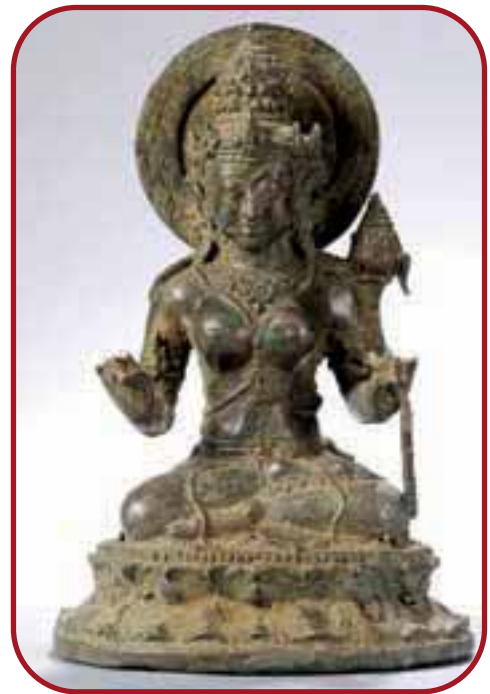
Lot n° 225 6 000/8 000 € Tara blanche Bronze airain. Royaume de Majapahit. Java Est. Indonésie. 12ème /14ème H 20,5 x L 14 cm