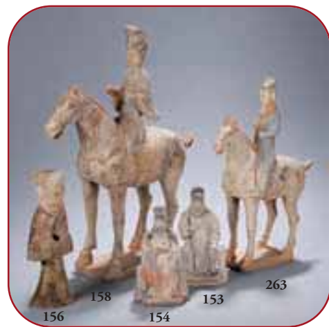
Lots n° 156, 158, 154, 153, 263 Archéologie, Terre cuite. Chine. Dynastie Han 2ème S, Tang 7ème à 10ème et Ming 15ème à 17ème