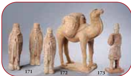
Lots n° 171, 172, 173 Archéologies, terre cuite. Dynastie Tang et Ming. 7ème à 15ème siècles.