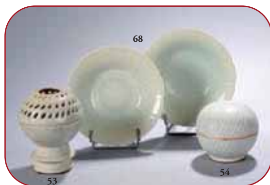
Lots n° 53, 68, 54 Porcelaines Qinbai céladon. Dynastie Song. Chine. 10ème à 13ème siècles.