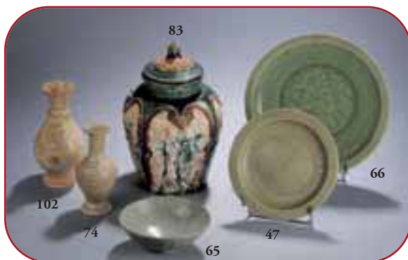
Lots n° 102, 74, 65, 83, 47, 66 Porcelaines céladon Song et Yuan 10ème à 14ème et poteries sançai Tang. Chine. 7ème à 10ème S.