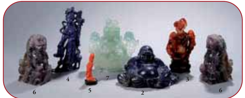
Lots n° 6, 4, 5, 7, 2, 3, 6 Sculpture en pierres semi précieuses. Chine.