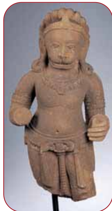
Lot n°239 5 000/6 000 € Narasimha, l'homme lion quatrième avatar de Vishnu. Pierre grès beige. Vallée du Gange. Dynastie Chalukya de l'est- Andhra Pradesh. 12ème à 14ème siècles. 36 x 70 cm