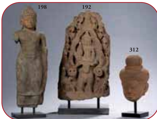
Lots n°198, 192, 312 Statuaire et hauts reliefs de temple. Pierre. Khmer. Cambodge. 8ème à 13ème siècle.