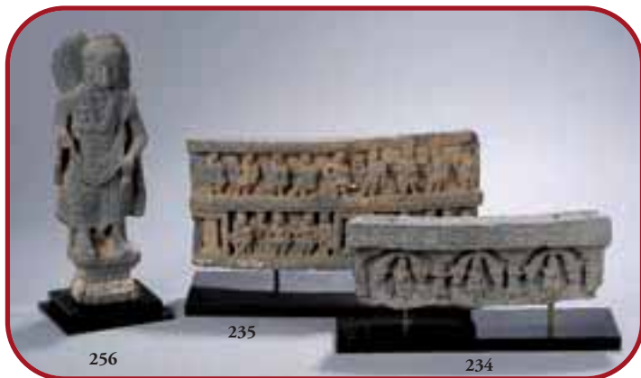
Lots n° 256, 235, 234 Statuaire et bas relief en schiste. Art Gréco Bouddhique. Gandhara. Afghanistan 2ème à 5ème