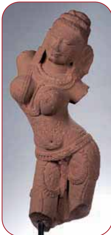
Lot n°243 7 000/8 000 € Apsara. Pierre grès rose. Dynastie Chandella. Khajurâho. Inde Médiévale. 11ème - 12ème. 65cm.