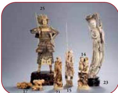
Lots n° 17, 25, 21, 15, 14, 23 Ivoires. Chine et Japon.