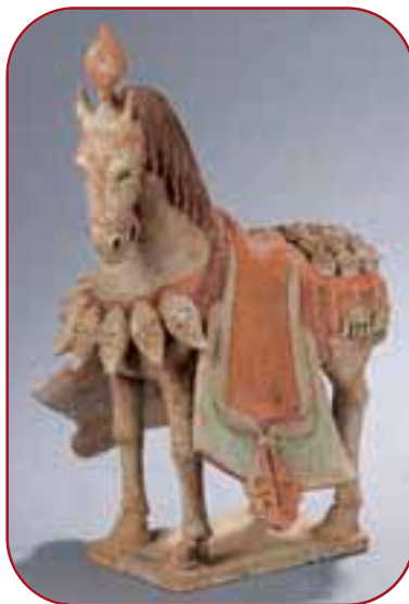
Lot n° 175 7 000/8 000 € Cheval caparaçonné. Terre cuite. Chine. Dynastie Wei du Nord 386 à 534. H 37 x L 33 cm.