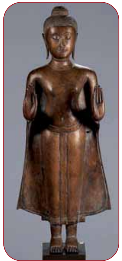
Lot n° 205 12 000/15 000 € Bouddha en Abaya Mudra. Bronze. Kampheng Phet. Thaïlande. 18ème. 110cm.