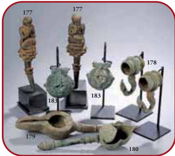
Lots n° 177, 179, 183, 180, 178 Bronzes d'archéologie. Asie du Sud Est. 1er siècle à 17ème siècle.