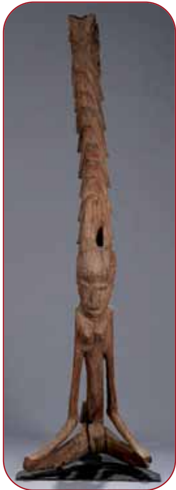
Lot n° 195 5 000/6 000 € Poutre faitière. Village Kambot. Rivière Keram. Bas Sepik. Début 20ième. 167cm