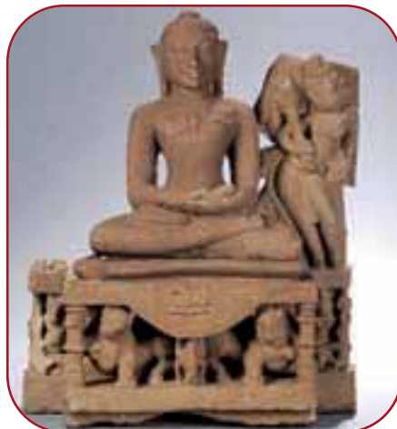
Lot n°249 3 000/4 000 € Tirthankara Jaïn. Pierre grès beige. Vallée du Gange. Inde médiévale. 11ème -12ème. 37x43cm. Accidents et manques.