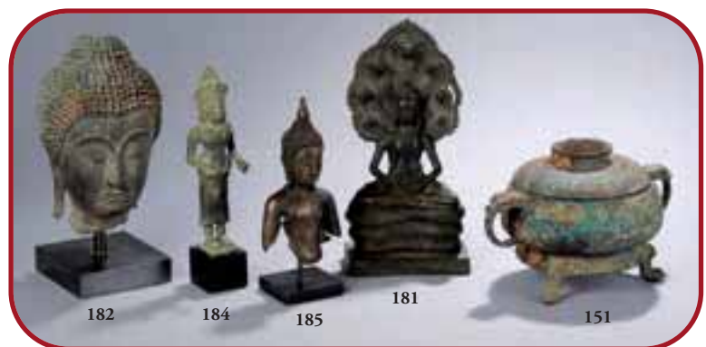
Lots n° 182, 184, 185, 181, 151 Bronzes d'archéologie. Asie du Sud Est. ` 13ème à 17ème et Chine 2ème avant J.C.