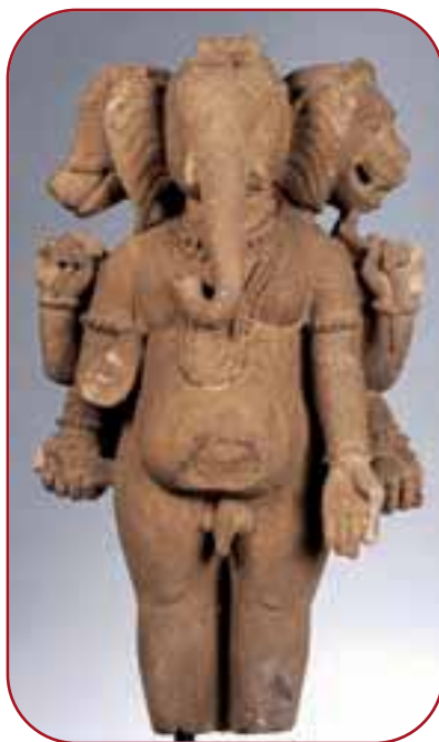
Lot n°241 5 000/6 000 € Ganesh tricéphale. Pierre grès beige. Vallée du Gange. Région de Kajuraho. Dynastie Chandella, Inde 10ème à 12ème S. 32 x 52 cm