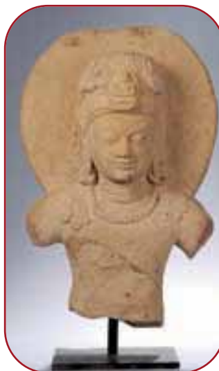
Lot n°246 7 000/8 000 € Buste de Bodhisattva. Pierre beige. Inde Centrale. Période post-Gupta, 7ème à 8ème. 30 x 46 cm