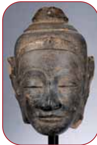
Lot n° 200 5 000/6 000 € Tête de Bouddha. Pierre laquée, dorée et de polychromée. Post Angkor. Post Khmer. Cambodge 15ème 16ème. 35cm.