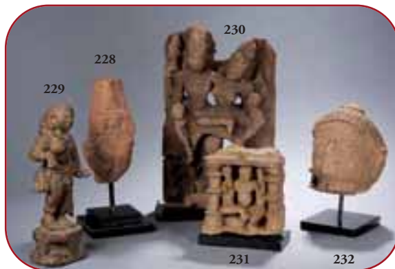
Lots n° 229, 228, 230, 231, 232 Statuaire et hauts reliefs de temple. Pierre. Inde médiévale. 10ème/12ème siècle.