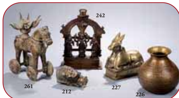
Lots n°261, 212, 242, 227, 226 Bronzes rituels. Inde. 17ème /19ème siècle.