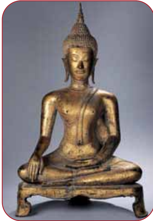
Lot n° 176 3500/4500 € Bouddha Maravijaya. Bronze laqué et doré. Royaume d'Ayuthaya. Thaïlande. 18ème 85x34cm.