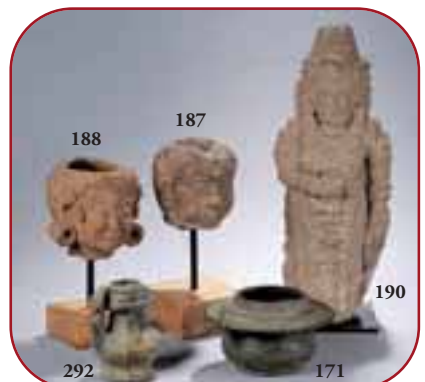
Lots n° 188, 292, 187, 171, 190 Statuaire et objets rituels. Pierre, terre cuite et bronze. Royaume de Majapahit. Java Est. 13ème à 14ème siècle.