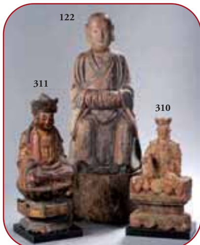
Lots n° 311, 122, 310 Statuaires. Bois. Dynasties Yuan, Ming et Qing. Chine. 14ème à 18ème siècle