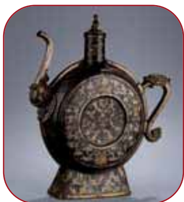
Lot n°147 2 000/2 500 € Verseuse de monastère. Fer, bronze et argent. Tibet. Fin 19ème. 55cm.