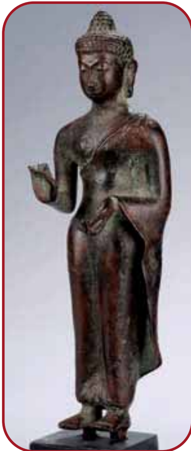
Lot n° 196 6 000/8 000 € Bouddha debout. Bronze à patine de fouille verte et rouge. Java centrale. Indonésie. 9ème 10ème .H 24 cm