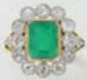
Bague or et platine, émeraude, diamants. 1700/2000 €