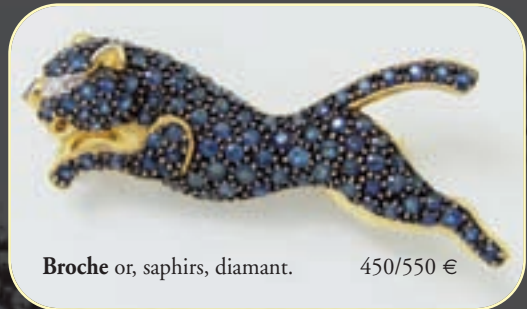
Broche or, saphirs, diamant. 450/550 €