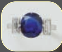
Bague or gris, saphir, diamants. 1100/1300 €

La vente se fera expressément au comptant. Frais de vente en sus des enchères 18% HT (soit 21.528% TTC)