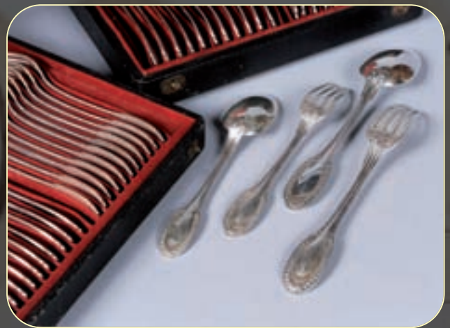
Suite de douze couverts de table et douze couverts à entremets en argent à filets, les spatules ornées d'oves, perles et feuillages. Pds 3.137g 1.000/1.300 €