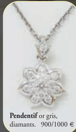
Pendentif or gris, diamants. 900/1000 €