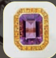
Bague or, améthyste, pierres fines. 1200/1500 €