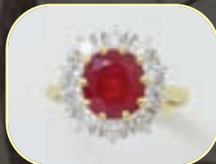
Bague or, rubis, diamants. 2000/2200 €