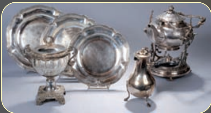
Suite de trois plats ronds en argent. Pds 2.192g 800/1.000 € Confiturier en argent. Terrasse feuillagée, gravée d'armoiries doubles sous une couronne de marquis. Paris 1819-38. Intérieur en verre blanc 1.000/1.200 € Verseuse en argent posant sur trois pieds sabots, Paris 1819-38. Pds brut 648g 600/800 € Fontaine à thé en métal argenté. Par Halphei 300/400 €