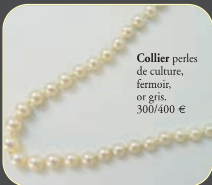
Collier perles de culture, fermoir, or gris. 300/400 €