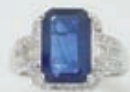
Bague or gris, saphir, diamants. 1800/2200 €