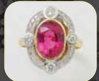
Bague or, tourmaline, diamants. 1100/1200 €