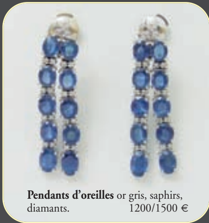
Pendants d'oreilles or gris, saphirs, diamants. 1200/1500 €