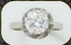
Bague or gris, diamant : 1.71 ct. 2500/3000 €