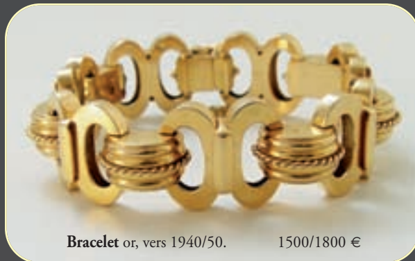
Bracelet or, vers 1940/50. 1500/1800 €